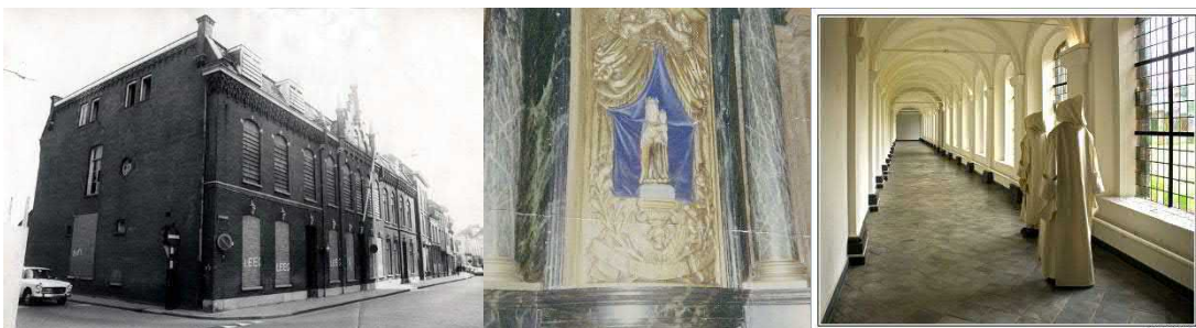
Oude foto plaats klooster Geertrui, beeldje Heilige Maria, Kartuziers.

Hier rond Kloostergang, Barbaradreef en Geertruikerkhof stond het grote Moderne Devotieklooster van de Regularissen(Augustijner Koorzusters). De Kapel en het Kerkhof werden in 1466 ingewijd, toen kon het uitbreiden beginnen. Het hele stuk tussen Orthenstraat 37-47 behoorde tot het klooster. Nu is het stuk tussen 37-41 nog een oud gedeelte, het andere stuk is nieuw. Het beeldje van de Heilige Maria trok vele bedevaartsgangers, vanwege de wonderen die aan haar toegeschreven werden.