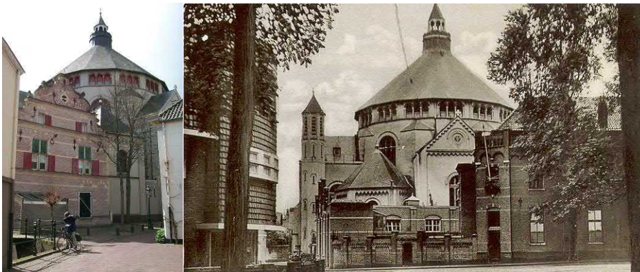
Catharinakerk(nieuwe en oude foto) aan het Kruisbroedershof.

Op de plek van de Catharinakerk stond eerst het complex van de Kruisheren of Kruisbroeders. De Kapel van de Catharinakerk stamt nog uit de tijd van het klooster. De Kruisheren werkten nauw samen met de Moderne Devoten. Een grote groep Kruisheren voegde zich uit Woudrichem bij de Kruisheren in 's Hertogenbosch.