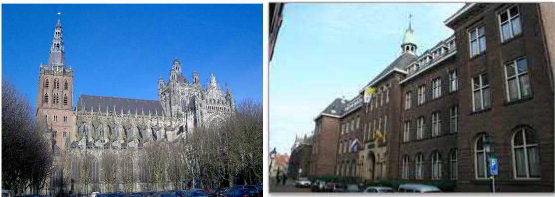
Sint Jans Kathedraal en Sint Jans Centrum

Fraters en Kanunniken(soms waren ze Frater en Kannunik) gingen later naar de Parade en Papenhulst 4 voor het seminarie.