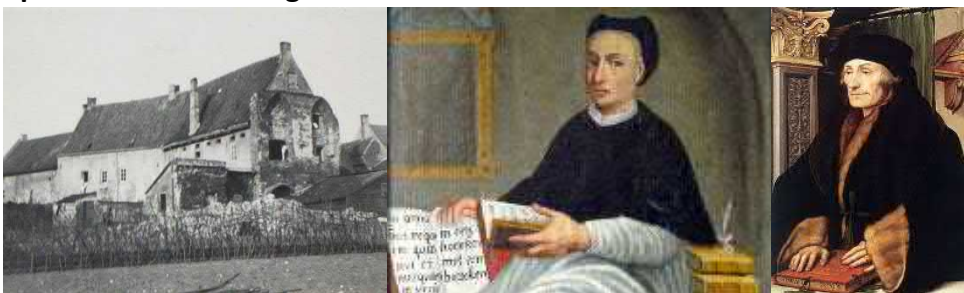
Deel Klooster Bethanië, vlak voor de sloop. Thomas a Kempis en Desiderius Erasmus waren allebei Augustijner Koorheren van de Moderne Devotie. Van Kempen en Erasmus hebben tot op de dag van vandaag wereldwijd invloed.

Naast Klooster Bethanië hebben zich ook Wilhelmiëten voor een periode gevestigd op de Windmolenberg.