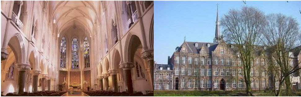
Kapel Mariënburg en Klooster Mariënburg op de Uilenburg.

contact kwamen met de wereld. Later trok de Orde van Jezus, Maria en Jozef in het klooster. Nu is het een uitgebreid Onderwijscentrum met Kapel.