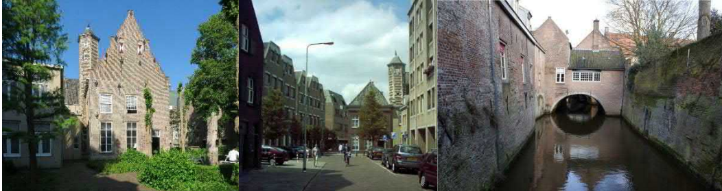
Refugiehuis Mariënbage, Achter de Tolbrug, Binnendieze.

Achter de Tolbrug is de plek waar uiteindelijk de Moderne Devote Tertiariissen van St. Elizabeth-Bloemkamp zich hebben gevestigd, en waar de Moderne Devote Windesheimer Koorheren van Mariënbage, uit Woensel bij Eindhoven, een Refugiehuis hadden op Achter de Tolbrug 11( werd een heel complex)