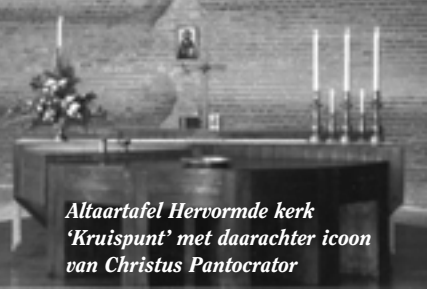
Altaartafel Hervormde kerk 'Kruispunt' met daarachter icoon van Christus Pantocrator