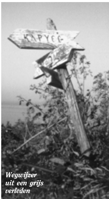
Wegwijzer uit een grijs verleden

Sedert mijn allereerste Athos pelgrimage heeft dit Russische klooster steeds een bijzondere aantrekkingskracht uitgeoefend.