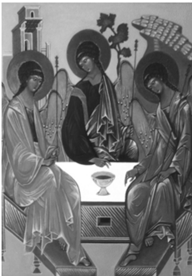
Icoon van de H. Drievuldigheid in de Hervormde Kerk 'Kruispunt'.

lening aan Roemenië. Aan de zijwand van de kerk heeft de icoon van de oudtestamentische Triniteit haar plaats. Deze icoon werd door een gemeentelid geschilderd en vervangt een reproductie van de beroemde icoon van Roeblev die de gemeente als geschenk kreeg bij het 15-jarig bestaan van haar kerkgebouw in 1984. De nieuwge-