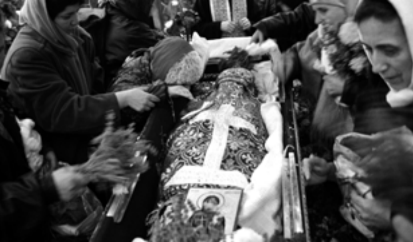
Gelovigen vereren de relieken van St. Paraschiva.

Constantinopel woonde ze vijf jaar in Heraklea in Pontus (Klein-Azië, het huidige Aziatische Turkije). Daarna vertrok ze naar het H. Land en trad in in een klooster bij de rivier de Jordaan. Rond haar vijfentwintigste kreeg ze een droom. Een engel vertelde haar dat ze moest terugkeren naar haar geboorteland om daar haar zuivere ziel in de handen te geven van haar hemelse 'Bruidgom'. Ze gehoorzaamde aan de wil van God en keerde terug naar Epivato, waar ze biddend en vastend het aangekondigde moment afwachtte. Het einde van haar aardse reis kwam spoedig, rond de leeftijd van 26 jaar.