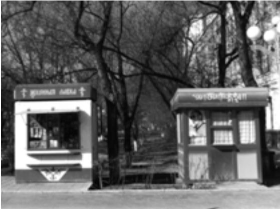
Russisch-orthodoxe en boeddhistische lavka's, winkeltjes, vredig naast elkaar in het centrum van Elista.

Nu staat de bisschop voor de opgave vorm te geven aan het geloofsleven. Hij heeft direct te maken met de Russisch-orthodoxe Kerk en haar structuur, welke zeker niet onderdoet voor de Rooms-katholieke Kerk. De hiërarchie, wet en regelgeving van beide kerken laten zich volgens de bisschop niet altijd even gemakkelijk vertalen naar het leven van alle dag. De Kalmukken hechten aan hun tradities, waarmee ook de kerk terdege rekening dient te houden. Trouw zijn aan de kerk, de mensen nabij zijn en opkomen voor hen die gebukt gaan onder problemen vraagt het uiterste aan tact, geduld en soms moed. Het zijn vaak de priesters op de werkvloer, die daarmee geconfronteerd worden en in de christelijke geest oplossingen dienen te creëren. Wat te doen met de vele problemen zoals armoede, criminaliteit, ziekte, abortus en aids? Vaak overkomt het mensen. Niemand vraagt daarom.