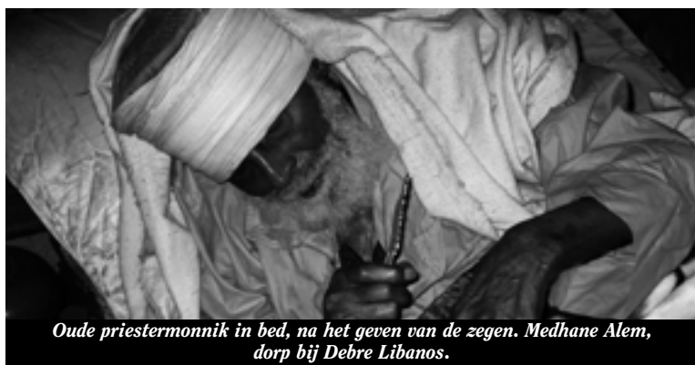
Oude priestermonnik in bed, na het geven van de zegen. Medhane Alem, dorp bij Debre Libanos.

Het huidige Ethiopië beslaat meer dan 30 keer Nederland en heeft 65 miljoen inwoners. Het historische Ethiopië omvat ook Eritrea, dat in 1991 onafhankelijk werd van Ethiopië en vanaf 1993 een zelfstandige orthodoxe Kerk heeft. Ethiopië is voor ongeveer de helft christelijk. De andere helft is islamitisch. Er is animisme en een autochtone vorm van jodendom. De Ethiopisch-orthodoxe Kerk maakt meer dan 90% van Ethiopië's christenen uit en is, na de kerk van Rusland, de grootste orthodoxe kerk ter wereld. Er zijn enkele honderdduizenden katholieken, van zowel de oosterse als westerse ritus. Daarnaast zijn er protestantse kerken, zoals de lutherse kerk, die tegen de drie miljoen gelovigen claimt, maar ook pentecostals en baptisten.