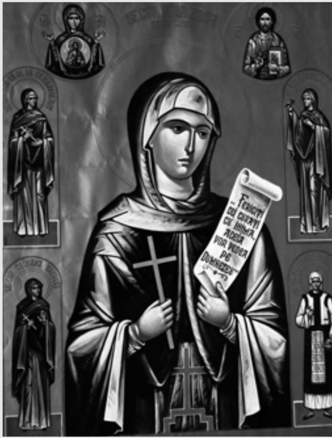
St. Paraschiva de Jongere, Roemeense icoon.

Gij koos voor een leven van stilte en eenzaamheid en voor het navolgen van Christus, uw Bruidegom. Gij nam Zijn zachte juk op toen ge nog jong waart en wapende u met het teken van het Kruis. Gij bestreed de spirituele vijanden met vasten, tranen en zwoegen, o roemvolle Paraskeva. Gij staat voor Christus, samen met de Wijze Maagden. Bid voor ons die uw gedachtenis vieren, dat wij worden gered.