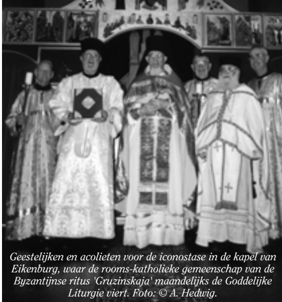
Geestelijken en acolieten voor de iconostase in de kapel van Eikenburg, waar de rooms-katholieke gemeenschap van de Byzantijnse ritus 'Gruzinskaja' maandelijks de Goddelijke Liturgie viert.

Het Slavisch-Byzantijns Koor Eindhoven bestaat 40 jaar. Dat werd op 2 juni gevierd met een plechtige viering van de Goddelijke Liturgie in de toonzetting van de Oekraïense componist Stecenka en onder leiding van dirigent Sascha Teunissen.