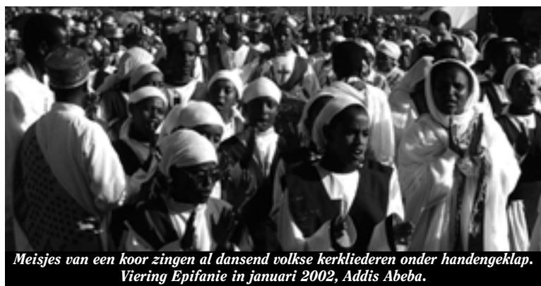
Meisjes van een koor zingen al dansend volkse kerkliederen onder handengeklap. Viering Epifanie in januari 2002, Addis Abeba.

De Ethiopische christelijke cultuur ontwikkelt een eigen gezicht. De opkomst van de islam in de regio vanaf de 7e eeuw