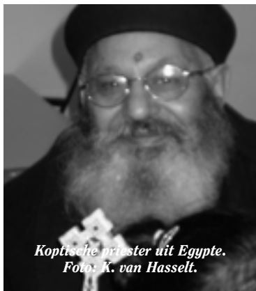
Koptische priester uit Egypte.

Dan wordt ook gehoor gegeven aan de oproepen die de zeven