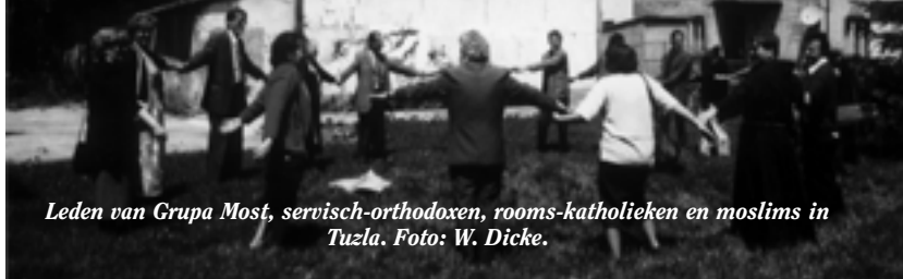
Leden van Grupa Most, servisch-orthodoxen, rooms-katholieken en moslims in Tuzla.

Desondanks staat de oecumene en de interreligieuze dialoog nog in de kinderschoenen. "De imam was hoofdimam van alle moskeeën van de stad, maar vanwege zijn vrijzinnige opvattingen, hij zegt 'Jullie God is ook onze Allah', is hij uit die functie ontheven. Hij is nu nog imam in de