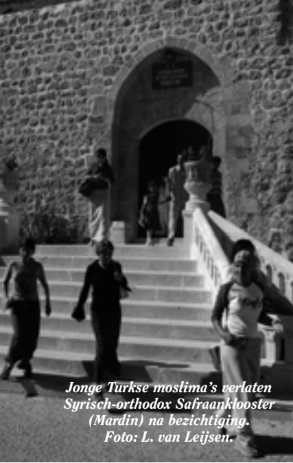
Jonge Turkse moslima's verlaten Syrisch-orthodox Safraanklooster (Mardin) na bezichtiging.

terse, 'christelijke' landen. Er zijn een aantal indicatoren - onder meer een toename van islamisme en fundamentalisme in bepaalde streken - die deze waarnemers gelijk geven.