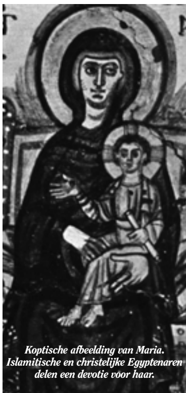
Koptische afbeelding van Maria. Islamitische en christelijke Egyptenaren delen een devotie voor haar.

De werkelijkheid is veel complexer dan bovengeschetst beeld doet voorkomen. In de eerste plaats vormen moslims en christenen in Egypte één en hetzelfde volk. Zij hebben over het algemeen dezelfde oorsprong (ethnisch gezien is 90% van de Egyptische moslims Kopt, nazaat van het faraonische Egypte) en leven in