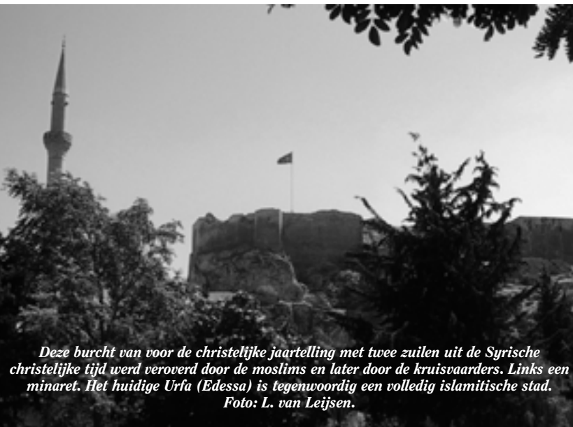
Deze burcht van voor de christelijke jaartelling met twee zuilen uit de Syrische christelijke tijd werd veroverd door de moslims en later door de kruisvaarders. Links een minaret. Het huidige Urfa (Edessa) is tegenwoordig een volledig islamitische stad.

(Vertaald en bewerkt uit het Engels door Leo van Leijzen.)