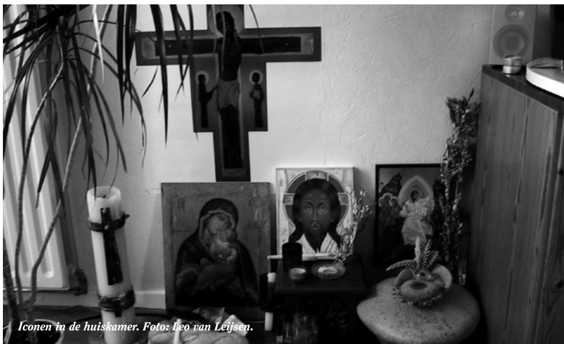
Iconen in de huiskamer.