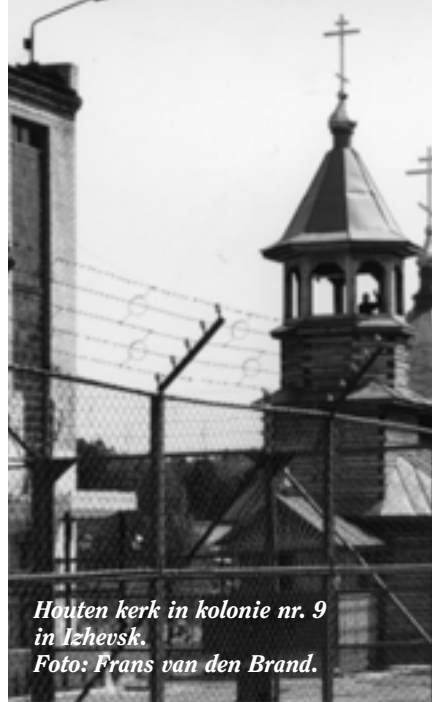
Houten kerk in kolonie nr. 9 in Izhevsk.

De kerk werd plechtig ingewijd door Vladiko Nikolai, het hoofd van de Russisch-orthodoxe Kerk in Oedmoertië, in aanwezigheid van generaal Zjeludov. De generaal, die zichzelf een zoekende