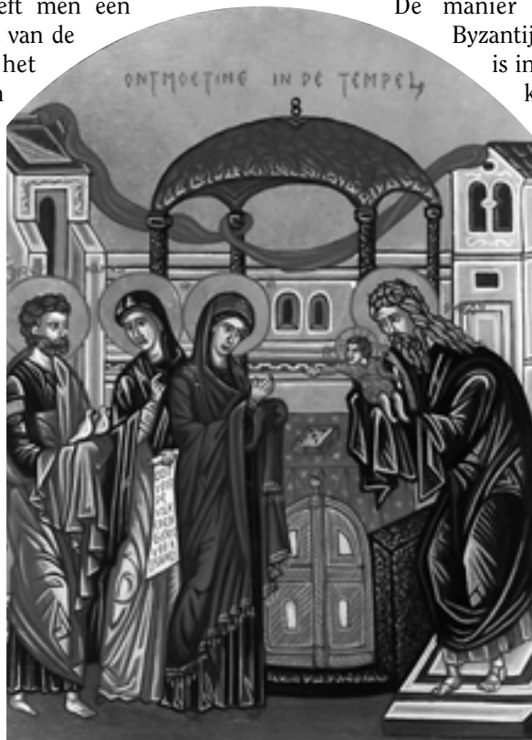
De Ontmoeting in de Tempel. Icoon en foto: Paul Brenninkmeijer.

Toch heb ik bij het schilderen van iconen vanaf het begin de intentie