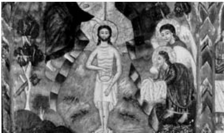
Jezus wordt gedoopt in de Jordaan.

Een goede doopcatechese die de oorspronkelijke betekenis en context van de doop verdui-