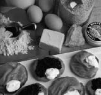
De ingrediënten voor het zelf bakken van blini's en het resultaat.

maal aan. Geen verwijt, alleen maar blijdschap om zijn terugkeer. De menselijke beperkingen komen scherp in beeld en worden in deze tijd op de proef gesteld. Wie kan zich zo grootmoedig en nederig opstellen? Zichzelf en gevoelens wegcijferen? De parabel toont dat de barmhartige Vader er onvoorwaardelijk zal zijn. Maar men moet zelf die stap naar Hem zetten.