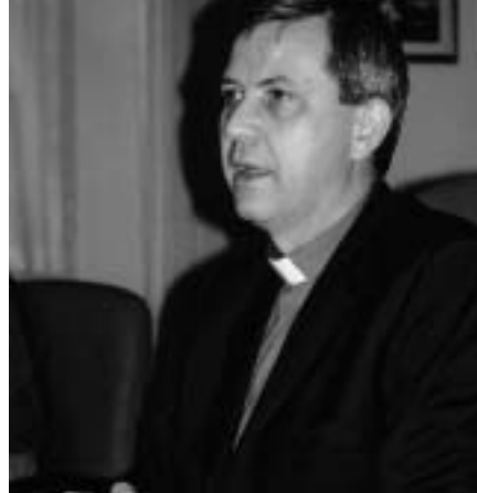
Mgr. Johan Borny.

De Pauselijke Raad kreeg van meet af aan een waaier van taken toebedeeld. Om te beginnen alles wat met de oecumenische activiteit van de Paus te maken heeft. Teksten of toespraken met een oecumenische dimensie, bezoeken van niet-katholieke kerkleiders aan Rome, oecumenische vieringen of ontmoetingen in het Vaticaan: die worden in regel door de Raad voor de Eenheid mee voorbereid en uitgevoerd. Dit geldt ook voor het oecumenische programma tijdens de reizen van de paus: de Raad voor de Eenheid werkt mee aan de voorbereiding van deze buitenlandse oecumenische vieringen of ontmoetingen. Bij de recente reizen naar Egypte, Syrië, Armenië, Georgië, Bulgarije, Roemenie of Oekraïne was dit oecumenische luik bijna de hoofdbrok! Verder houdt de Raad voor de Eenheid de paus op de hoogte van de belangrijkste gebeurtenissen of ontwikkelingen op oecumenisch gebied. Met grote aandacht volgt