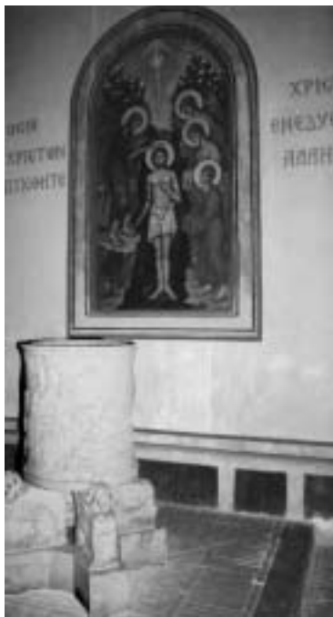
'Gij allen die in Christus zijt gedoopt, hebt u met Christus bekleed', staat er in het Grieks bij deze icoon van Jezus' doop in de Jordaan. De icoon hangt boven de doopvont in de kerk van het Grieks-katholieke klooster Grottaferrata bij Rome.

van het luisteren naar Gods lokroep in ons leven. De heilige Geest schenkt ons in de gave van de profetie de gave van het onderscheidingsvermogen om Gods wil, zijn stem, te horen en tegelijk te getuigen van zijn wijsheid en liefde. Zoals voor de profeten in de heilige Schrift geldt het inzicht ook voor de gave van de profetie van alle gedoopten: de profeet zoekt de eenheid met God en van daaruit levend begrijpt en beschouwt de profeet deze wereld. Door deze profetische gave van het onder-