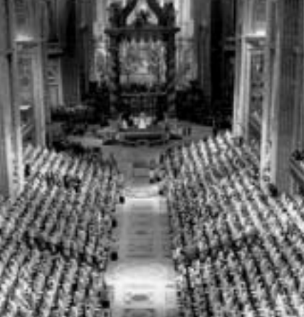
Vergadering tijdens Vaticanum II. Paus Johannes XXIII stichtte het Secretariaat voor de Eenheid op 5 juni 1960 om de oecumenische activiteit van Vaticanum II (1962-1965) te organiseren.

oecumene in Spanje of oecumene in India. Elk land, elke regio heeft eigen oecumenische zorgen en vreugde. Daarover kunnen de plaatselijke bisschoppen uitstekende informatie bezorgen.