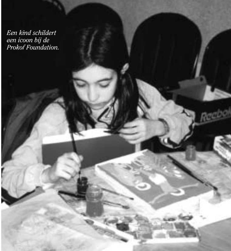
Een kind schildert een icoon bij de Pokrov Foundation.

theologische cursus op hoog niveau met sprekers van theologische faculteiten uit binnen- en buitenland. Er zijn culturele avonden en cursussen (zang, dans, muziek, iconen schilderen enz.) en er worden bedevaartstochten georganiseerd voor parochieleiden. Het kerkelijk centrum biedt gedurende het jaar een keur aan discussieavonden aan over actuele thema's in kerk en maatschappij om zo deze twee dichterbij elkaar te brengen en samen van gedachten te wisselen over de verantwoordelijkheden van de kerk en de kerkleden voor ontwikkelingen in de maatschappij.