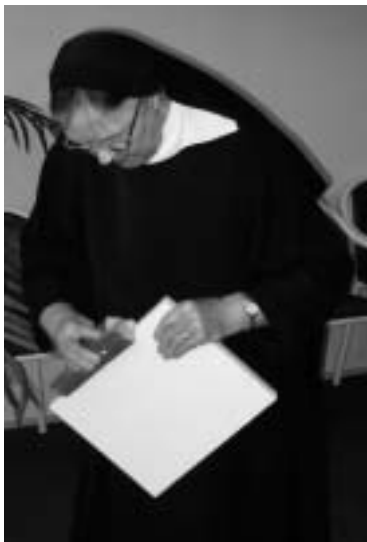
Het schaven van de plank.