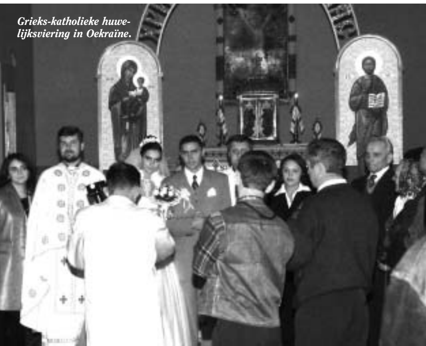
Grieks-katholieke huwelijksviering in Oekraïne.

Na haar unie met Rome in 1596 werd de Oekraïense Grieks-katholieke Kerk 'roomser', wat ten koste ging van haar orthodoxe oorsprong. Maar sinds 1990 en onder aansporing van de huidige paus oriënteert zij zich meer op haar wortels. Dat blijft niet zonder gevolgen. Binnen deze kerk wordt verschillend nagedacht