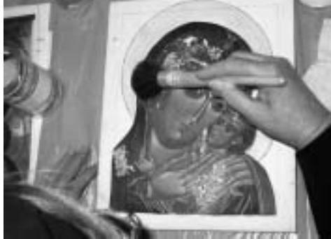
Het aanbrengen van goud.

De pigmenten waarmee wordt geschilderd, worden gemengd met eigeel. Alléén met het eigeel, zodat het ei voorzichtig ge-