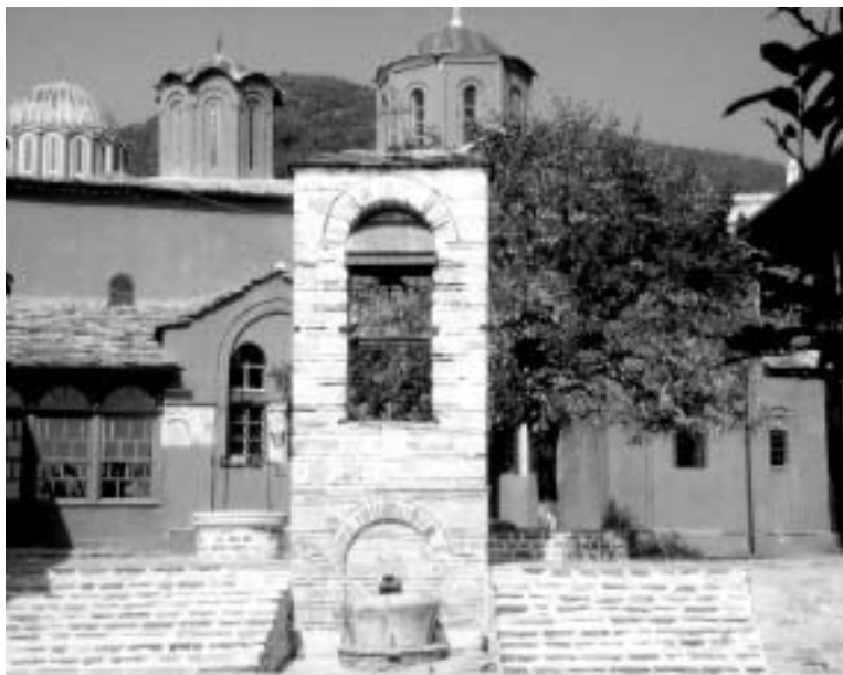
Ingang van het Athosklooster Xenofontos.

terte dat valt onder een groot klooster. We worden eerst de kapel binnengeleid om de iconen te begroeten en een kaars op te steken. Dat alles heeft iets heel moois. Vervolgens wandelen we naar de zee en dalen langs steile treden af naar de grot waar de eerste monnik van Athos, Athanasios, zich duizend jaar geleden heeft teruggetrokken. Onvoorstelbaar hoe een mens in deze ruwe eenzaamheid heeft