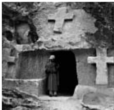
Een jonge kluisenaar buiten de rotskerk die hij heeft uitgehouwen uit de rots in Ettisa, de geboorteplaats van de beroemde heilige monnik Tekle Heymanot.

ken. Deze traditie kwam weer tot leven in het klooster Abunä Habtä Mariam, in de diepe vallei achter Debre Libanos, ongeveer 100 km ten noorden van Addis Abeba waar vele eremieten in grotten wonen. Naarmate de kloosters naar het zuiden drongen, hebben zij meer plaatselijke bouwmaterialen gebruikt; daardoor werden die kloosters geïntegreerd in het landschap.