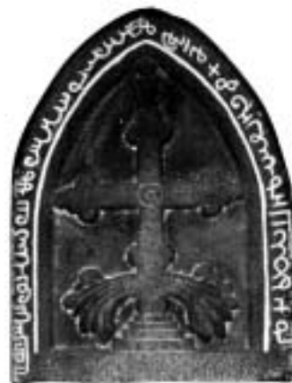
Syrisch kruis, Kerala (India).