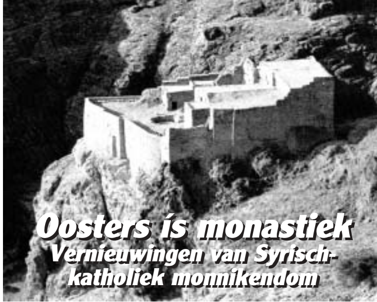
Het klooster Mar Moesa (H. Mozes) in de jaren '90.

maar geen echt monastiek leven meer leiden. Armenië is tegelijkertijd bezaaid met de resten van oude monastieke centra en de Armeense traditie en cultuur zijn in belangrijke mate een creatie van monniken.