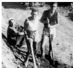
Joodse dwangarbeiders in 1942. Joden werden in WO II slachtoffer van mede-Europeanen van christelijken en niet- christelijken huize. In Bulgarije ontkwamen veel joden aan de dood door de inzet van de Orthodoxe Kerk.