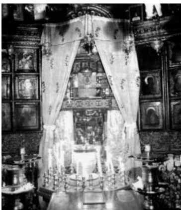
Al-Shaghoura, het heiligdom met de wonderbare icoon van de H. Maagd Maria.

De plaats van het patriarchale klooster van Onze Lieve Vrouw van Saindaya wordt als een van de meest heilige plaatsen in de wereld beschouwd. Het klooster werd bijna 1500 jaar geleden gebouwd, in 547 nC. Het klooster herbergt een bibliotheek die belangrijke en zeer waardevolle collecties handschriften bevat. Daarnaast is er het heiligdom van Al-Shaghoura, waar een icoon van de H. Maagd Maria hangt. De icoon zou, zo zegt de traditie, zijn geschilderd door de evangelist Lukas. Het prachtige gebouwencomplex is gesitueerd op een hoge berg en kijkt uit over de stad Saindaya beneden zich.