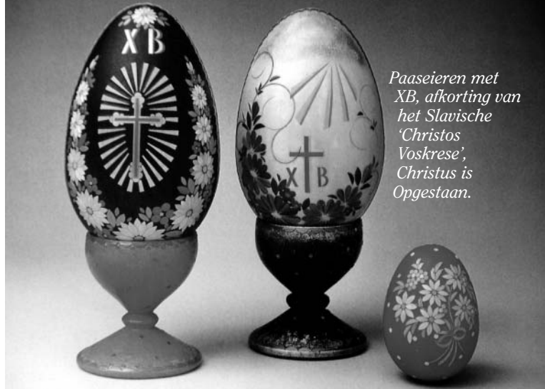
Paaseieren met XB, afkorting van het Slavische 'Christos Voskrese', Christus is Opgestaan.

In oosters-christelijke landen werden de paaseieren oorspronkelijk alleen rood geverfd en in Slavische landen voorzien van de letters XB, Christus is opgestaan. Een paasfeest zonder eieren was en is ondenkbaar. Eieren, die tegenwoordig ook in andere kleuren voorhanden zijn, worden druk uitgewisseld, zowel in de kerk als op straat. De schenker zegt daarbij 'Christus is opgestaan', een formule die de ontvanger beantwoordt met: 'Hij is waarlijk opgestaan'. Ook, of misschien wel juist de doden worden niet vergeten: in dierbare herinnering worden mandjes met eieren bij graven gezet. Over het ontstaan van de rode paaseieren zijn tal van legenden in omloop. Een Roemeense legende vertelt ons hoe een christelijk en een heidens meisje terugkwamen van de markt met hun korven vol eieren. De laatste zei dat zij alleen in Jezus' opstanding zou geloven als de witte eieren in de mand rood werden. Deze werden natuurlijk prompt rood, waarop de meisjes van schrik flauwvielen. Twee jongens zagen dit, brachten hen bij met een plens water en kregen de