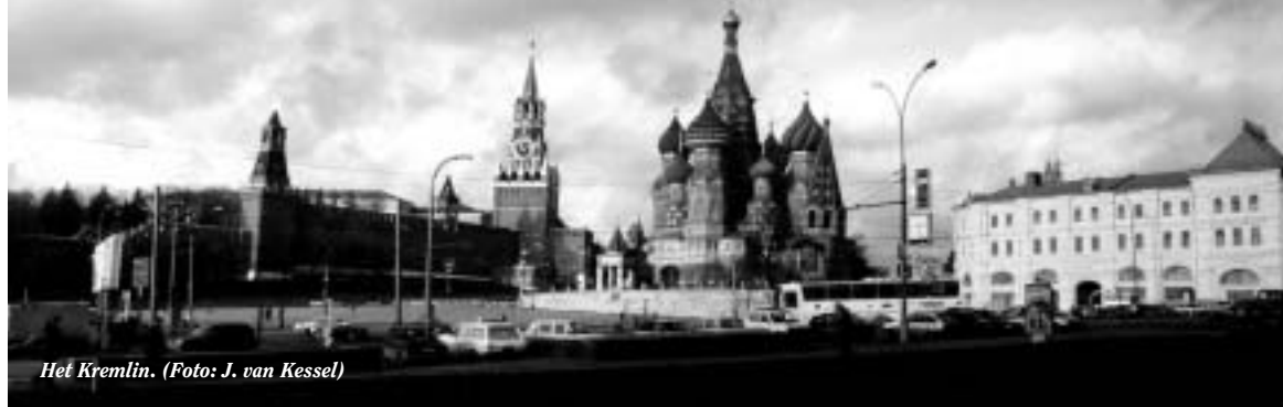
Het Kremlin.