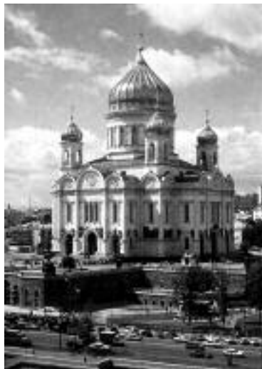
De Christus Verlosser-kathedraal in Moskou.