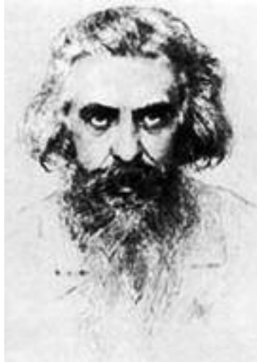
Vladimir Solovjov (1853-1900).

van eenheid: ‘we hebben het niet alleen over één aspect van de werkelijkheid, maar over de werkelijkheid in haar geheel’. Dat is een terugkerend motief.”