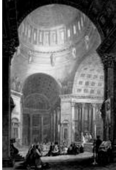
Prent uit de 19e eeuw van de Nikolskij Sobor in Sint Petersburg met daarin de verzamelde geloofsgemeenschap. Het 'verheffende' van de ruimte laat aan de houding van de gelovigen niet veel keuze over.

Men kan de rol van de priester in de Byzantijnse liturgie natuurlijk