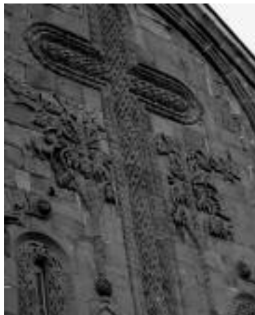
Gevel van de Georgische Ananuri-kerk met sierlijk basreliëf in steen.

Naast de Orthodoxe Kerk zijn er kleine kerkgenootschappen actief, zoals baptisten, evangelicalen en ook Jehova's Getuigen. Met name de laatste groepering heeft voor religieuze spanningen gezorgd. Binnen de Orthodoxe Kerk groeide het verzet tegen dergelijke kleine zeer evangeliserende christenen, omdat die nogal eens agressieve methoden van beke-