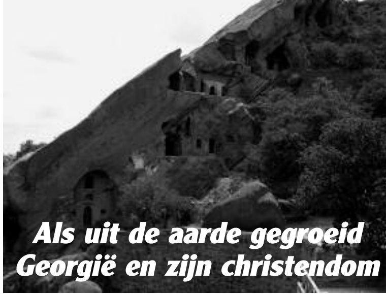
Oude verblijfplaatsen van de monniken in het kloostercomplex van David Gereji in Zuid-Georgië, vlakbij de grens met Azerbeidzjan.