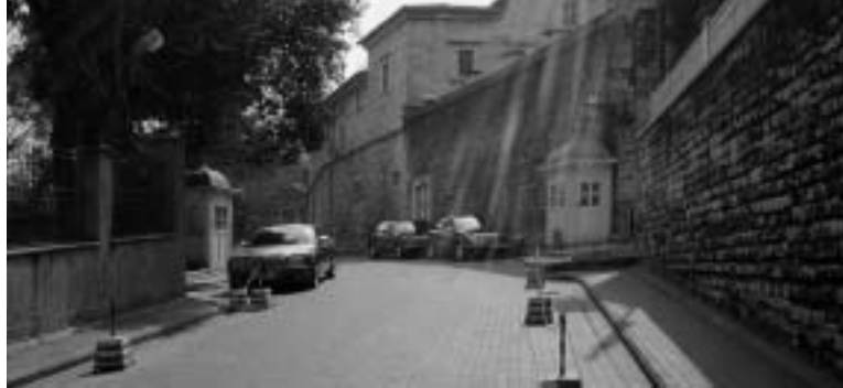
Straat met rechts de ingang van 'het Fanar', de residentie van de oecumenisch patriarch in de Istanbuls wijk Fener aan de Gouden Hoorn.

zoekende naar wat islam en christendom bindt. Voor zover bekend is de Regensburger rede van september 2006 niet expliciet onderwerp van gesprek geweest. Deze rede, door vele moslims (en niet-moslims) opgevat als een uitspraak van de paus over de relatie tussen geweld en islam, leek even nog aanleiding te worden om het bezoek geen doorgang te laten vinden, maar uiteindelijk lijken de vele reacties op zijn woorden in september de paus extra alert te hebben gemaakt op de gevoeligheden in de verhouding islam-christendom.