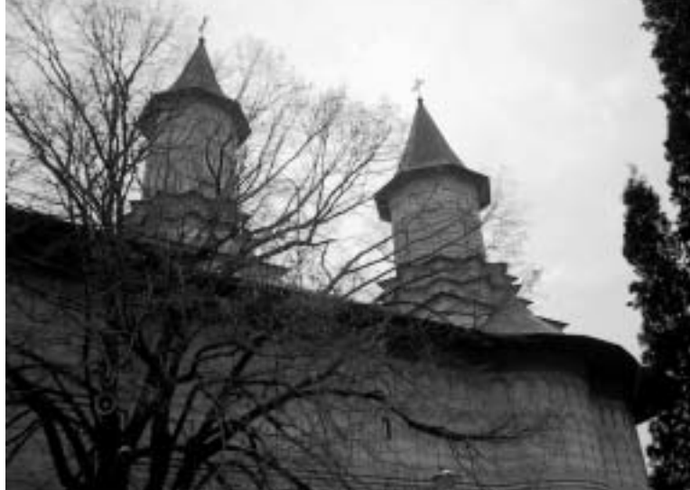
Roemeens-orthodoxe kerk in het najaar, bij nonnenklooster te Iasi, een van de vele kloosters aan de rand van "de spirituele hoofdstad van Roemenië".