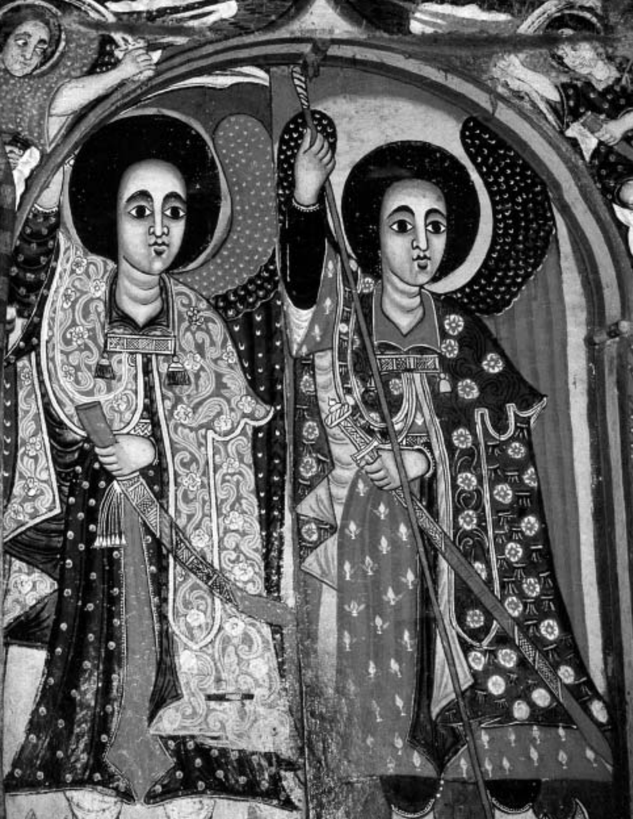
Michaël en Gabriël op wacht met zwaard en lans aan de ingang van het kerkgebouw. Fresco in de kerk 'Maria van de krokodril' op het schiereiland Zeghie in het Tanameer, Ethiopië. (Foto: L. Heiser, Äthiopien erhebe seine Hände zu Gott. Die Äthiopische Kirche in ihren Bildern und Gebeten, St. Ottilien 2000. Vanuit de Duitse teksten in dit boek zijn ook de vertalingen van de Ethiopische gebeden in deze meditatieve bijdrage gemaakt.)