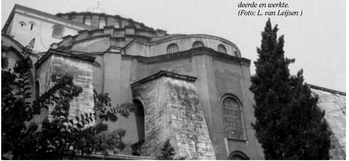
Kerk van de H. Wijsheid (Aya Sofia), de kerk van Byzantium's hoofdstad Constantinopel, waar Nikolaos Cabasilas leefde, studeerde en werkte.