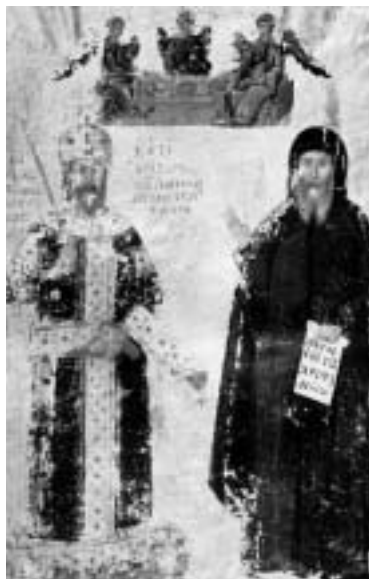
Johannes VI Kantakouzenos als keizer én (later) als monnik. Verluchting van Byzantijs handschrift uit Constantinopel, rond 1370-1375.

In de hele liturgie is het leven van Christus de onderstroom en haar opbouw wordt erdoor bepaald. De rite representeert in harmonische orde de verschillende fasen van het leven van Christus. Enige voorbeelden: de prothèsis (dienst van de voorbereiding, helemaal aan het begin van de Goddelijke Liturgie of eucharistie, red.) stelt de eerste periode voor: Christus’ verborgen leven. Bij het binnendragen van het Evangelieboek (Kleine