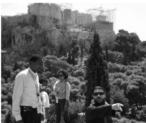
Athene. Een Orthodox geestelijke leidt de Ethiopische pelgrims rond aan de voet van de Akropolis.

er een bijzonder inspirerende ontmoeting met een groep schrijvers en journalisten die betrokken zijn bij interreligieuze en vredesopbouwende activiteiten. Tenslotte was er een ontroerende ontmoeting met de vice-moefiti van Istanbul. En in Antiochië, dicht bij de Turks-Syrische grens, vingen we nog een glimp op van de voorbije glorie van het Oosters christendom en zijn interactie met de Islam.