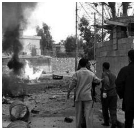
Brand na aanslag op een christelijk gebouw in Noord-Irak.