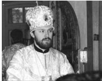
Bisschop Hilarion Alfeyev, de grote afwezige aanwezige van Ravenna 2007.

Of het inhoudelijke positieve resultaat: oosters-orthodoxe