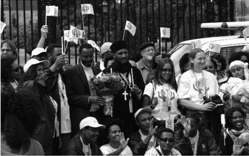
Den Haag. Met het Vredespaleis in de rug, wordt de blik feestelijk al gericht op het verre einddoel: Ethiopië.

In 2007 vond naar aanleiding van de viering van de millenniumwisseling (in onze jaartelling op 12 september jl.) in Ethiopië, 'Amen Ethiopia' plaats, een pelgrimstocht van de hoop. Vanuit Den Haag vertrokken vier auto's via Rome, Istanbul en Jeruzalem naar Addis Abeba.