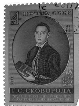
Postzegel uit de Sovjet-Unie bij Skovoroda's 250ste geboortjaar (1972).