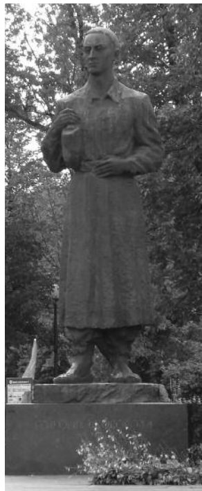
Monument van Hryhorij Savyč Skovoroda (1722-1794) in het centrum van Kiev.

Skovoroda werd soms de Oekraïense Sokrates genoemd. Bij een andere gelegenheid werd hij een Oekraïense Rousseau. Weer een andere keer maakte men hem tot een voorloper van Tolstoj, of werd hij, bij Sovjet denkers, een vooraanstaand vertegenwoordiger van progressief denken. Patriottische Oekraïense geleerden, in het bijzonder in de ballingschap, wilden van Skovoroda een representant van de nationaal-Oekraïense mentaliteit maken. Zijn tijdgenoten noemden hem soms starčšik , met een toespeling op de zogeheten 'startsen', de eremieten en geestelijke vaders die voor de Russische Kerk altijd