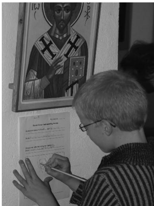
Eén van de deelnemers aan de workshop tekent zijn favoriete icoon na.

dichtbij wordt. De ontmoeting met Rembrandt was voor ons een feest, dat ons het hele leven bij zal blijven.