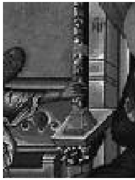
4. De rechterhand van de aartsengel het goede nieuws te delen.

De aartsengel Gabriël is in een onstuitbare dynamiek verwickeld. Hij is niet van hier. Hij lijkt bevangen door een heilige haast en is één en al beweging namens de Geest. Zijn kleding wappert, er waait een herscheppende wind(3). Het gebaar van zijn rechterhand staat voor de zegening die de 'hand Gods' brengt. Tevens staat het voor zijn spreken: 'Verheug u, begenadigde, de Heer is met u' (Lc. 1, 28). En misschien wil hij er zelfs wel mee aanwijzen: jij bent het, de gezegende onder de vrouwen, zoals Elisabeth later zal zeggen (4).