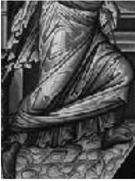
3. Gabriël in een heilige haast om zegg aan.