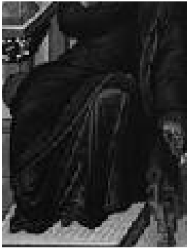
5. In haar linkerhand houdt ze een spoel met purperdraad.

Maria zit op een verhoogde zetel. Ze troont als vrouwe wijsheid op een purperen kussen zoals eens de wijze koning Salomo deed. Haar gracieuze wijsheid onderstreep haar waardigheid als moeder Gods. Zelfs haar voeten worden verheven door een voetbank, terwijl de engel de aarde nog even aanraakt. Dit geeft aan dat Maria als moeder van God verheven is boven Gabriël. In haar linkerhand houdt zij een spoel vast. Als godsvruchtige vrouw was haar de bijzondere eer te beurt gevallen om het purper te spinnen waaruit het voorhangsel van de tempel wordt geweven (5).