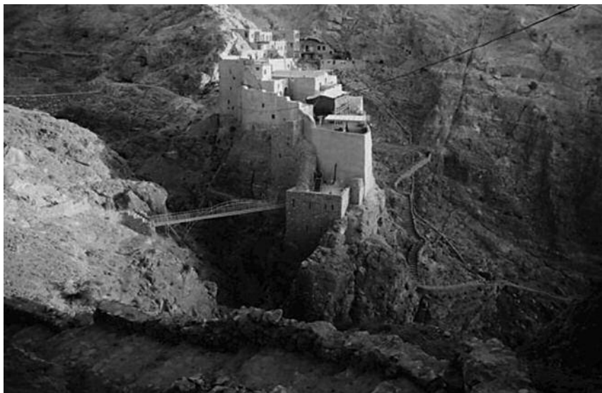
Het zesde-eeuwse klooster Deir Mar Musa

Jeugdig protestants Kloetinge ontmoet christelijke Oriënt