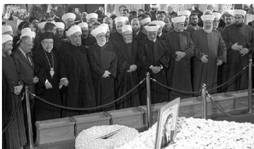
Soennietische, sjiietische en Grieks-orthodoxe geestelijken bij het graf van Hariri.

tegenwoordigd moeten zijn. Maar hij vergat dat diezelfde grondwet alleen aan het parlement het recht toekent om een regering te doen vallen. Omdat het parlement de regering zou steunen, besliste de president daarvan, de sjiiet Berri, het parlement niet meer bij elkaar te roepen onder het motief dat er geen legale regering was. Zo werden de politieke instituties van Libanon geblokkeerd. Die wankel situatie duurde meer dan een jaar.