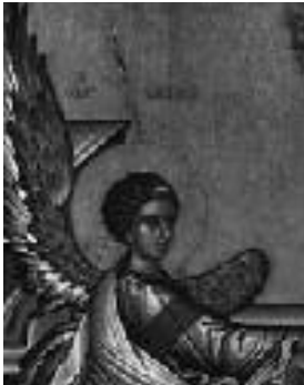
1. Gabriël verkondigt het goede nieuws van de komst van Christus.

Het verhaal van het feest van de verkondiging wordt theologisch begeleid door Lucas 1, 26-39. De aartsengel Gabriël komt naar Maria met de woorden: 'Verheug u, begenadigde, de Heer is met u.' Maria stond perplex en dacht na over wat dit wel niet te betekenen zou hebben. De engel zei tot Maria: 'U zult zwanger worden en een zoon baren, die u de naam Jezus moet geven.' Maria echter raakte eerder bevreesd dan overtuigd. Daarop stelde de engel haar gerust en sprak over haar nicht Elisabeth, die evenals zij iets wonderlijks zou mee maken. Elisabeth zou midde in haar ouderdom een zoon ontvangen, Johannes de Doper. Maria zou gewoon een kind ontvangen op jonge leeftijd. Maar het was niet zo gewoon dat ze niet getrouwd was. Dat bracht haar leven in de gevarezone. Zwanger worden zonder een man was een heikel wonder: 'de heilige Geest zal over u komen'. Na een grondige dialoog zegt Maria moedig ja op een onoverzichtelijk avontuur: 'Zie hier de dienares van de Heer, mij geschiede naar uw woord.'