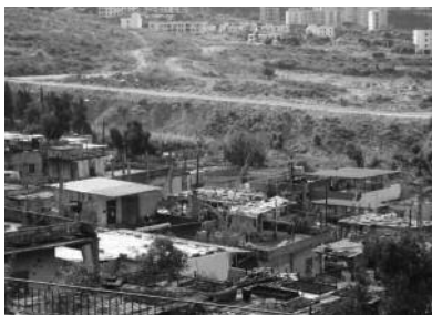
Het vluchtelingenkamp Dbayah in Libanon. De fysieke markering tussen het kamp en de gewone Libanese flats spreekt voor zichzelf.

In het weekend van 19-20 april 2008 wordt in de parochies de jaarlijkse Zondag voor de Oosterse Kerken gevierd. De Zondag voor de Oosterse Kerken 2008 stelt de christenen van het Heilig Land, Israël en de Palestijnse gebieden, centraal. De zondag belicht hun ‘leven tussen uitersten’. Het project van deze zondag is ook bestemd voor christenen van het Heilig Land, maar in dit geval voor degenen die moesten vluchten na 1948: het werk van de Kleine Zusters van Nazaret in het christelijk Palestijnenkamp Dbayah bij Beiroet. U kunt de zusters steunen door een bijdrage op giro 1087628 t.n.v. Katholieke Vereniging voor Oecumene, ‘s-Hertogenbosch o.v.v. ‘project Dbayah’. Informatie en materiaal voor de Zondag voor de Oosterse Kerken zijn te verkrijgen op www.oecumene.nl of via secretariaat@oecumene.nl