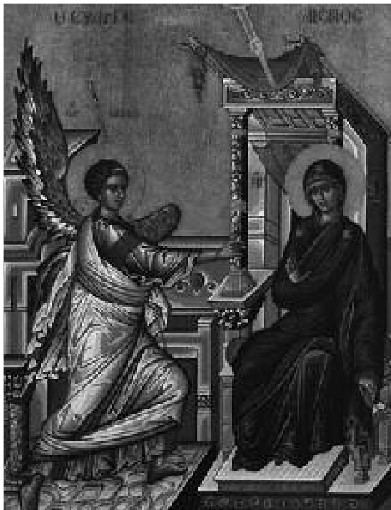
Begin 14e eeuw. Ohrid, iconengalerij van de Sint Clemenskerk.

Het feest van de verkondiging van de Heer, ofwel de annunciatie, wordt elk jaar gevierd op 25 maart in Oost en West. Het is een feest met oude kaarten. Het gedenkt de verkondiging van de aartsengel Gabriël aan Maria dat de verlosser van de wereld via haar schoot in de wereld zal komen. In het westen staat het bekend als Maria Boodschap. Echter, dit feest heeft vooral een christologische klankkleur, omdat het in dienst staat van de verlossing die Christus brengt. Vandaar dat het Oosten liever spreekt van het feest van de verkondiging van de Heer.