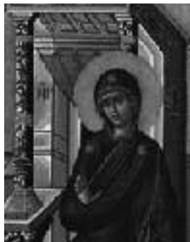
2. De maagd Maria is verkozen de moeder van God te worden.