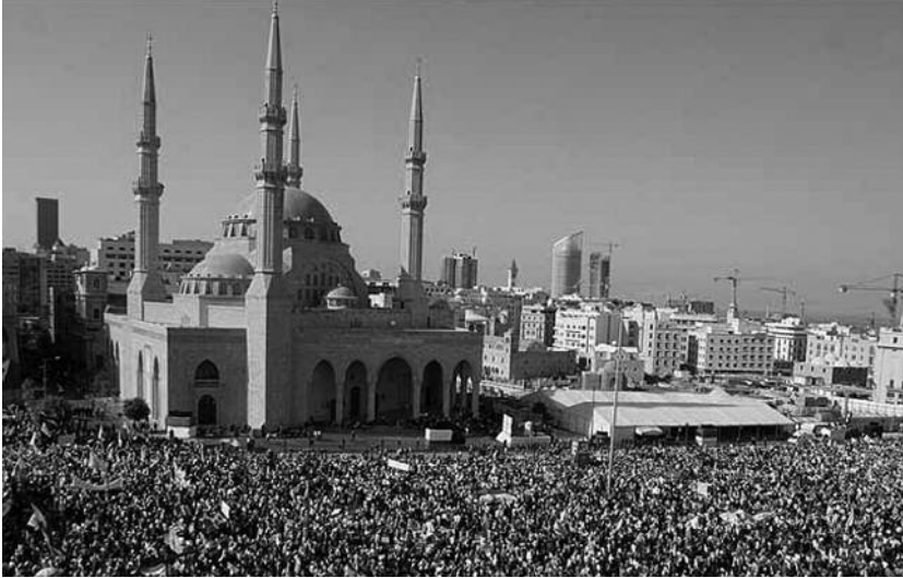
Grote demonstratie tegen Syrië voor de moskee in Beiroet waar Hariri begraven ligt.

Sinds de moord op Hariri is er heel veel gebeurd in Libanon. Het is vanuit Nederland moeilijk om helder te krijgen wat nu de positie van christenen is, kerkelijk, maatschappelijk en politiek. Wellicht ook omdat de meest in het oog springende tegenstellingen thans die tussen sjiiëten en sunnieten én tussen pro- en anti-Syriërs lijken te zijn. Bij die laatste tegenstelling zijn aan beide zijden christenen te vinden.