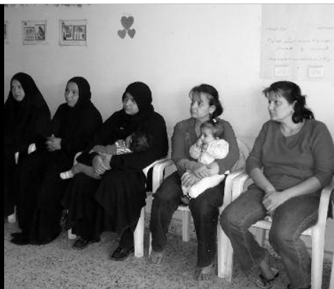
Het consultatiebureau van Caritas Irak is voor christenen en moslims.

Ieder jaar selecteert de Katholieke Vereniging voor Oecumene voor de Zondag voor de Oosterse Kerken een project of enkele projecten die gesteund zullen worden vanuit de opbrengsten van de collectes op deze zondag. Dit jaar betreft het de educatieve projecten van Caritas Irak: