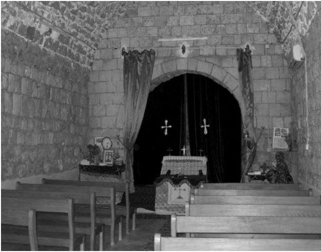
Interieur van de kerk van het Assyrische Mor Odisho-complex te Dere, ooit verwoest door het regime van Saddam, nu gerestaureerd.

regio behoort tot het Arabisch gedeelte van Irak, althans officieel. Deze relatief beperkte geografische afbakening wordt door sommigen als kunstmatig ervaren. Zij wijzen erop dat in aangrenzende gebieden, gelegen binnen de Koerdische Autonome Regio, ook een aantal christelijke dorpen is waar men Sureth spreekt en dat deze dorpen ook tot de Atrâ zouden moeten behoren. Afgezien van het probleem dat het niet zo duidelijk is welke groep dorpen binnen Koerdistan bij de Atrâ zou moeten behoren (er circuleren verschillende opties), stelt dit uiteraard de vraag naar de relatie van de Atrâ met de centrale overheid of de Koerdische Autonome Regio, misschien zelfs de vraag naar een Atrâ onder gedeeltelijk Koerdische paraplu. Het is duidelijk dat de partijen die het streven van hervestiging in Koerdistan steunen, gewonnen zijn voor deze laatste optie. De numeriek sterkste christelijke partij, de eerder genoemde ADB, kiest voor een Atrâ onder centraal gezag.