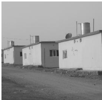
Christelijk dorp, herbouwd met de steun van de Koerdische regering.