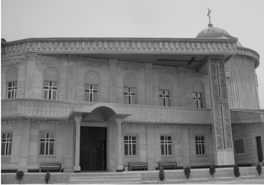
Zijaanzicht van de recent gebouwde Assyrisch-apostolische kathedraal van Aynkawa-Erbil, Noord-Irak.