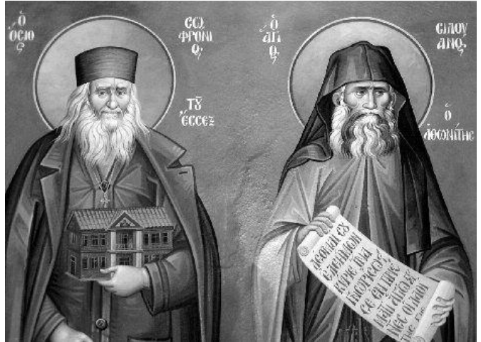
Moderne Griekse icoon met (van rechts naar links) St. Silouan en de gezegende Sophrony.

Het eerste deel is geen biografie. De feiten over zijn leven zijn niet erg talrijk en het verslag ervan doet denken aan een klassiek heiligenle-