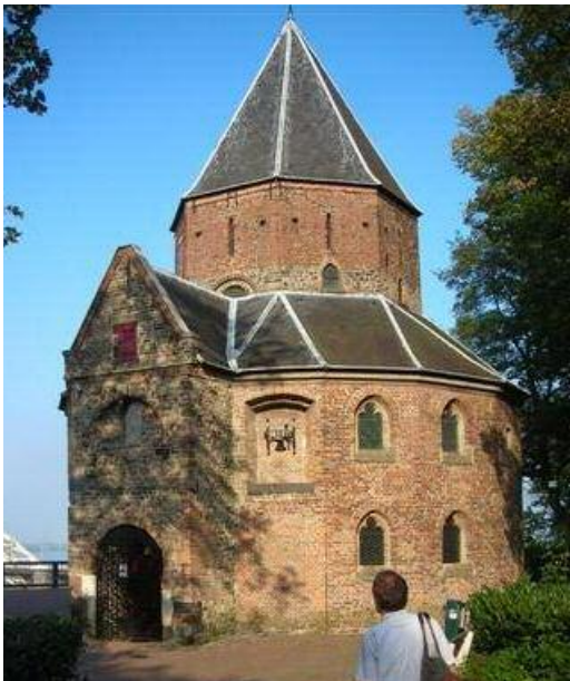
Nikolaaskapel op het Valkhof (gebouwd eind 10de eeuw).