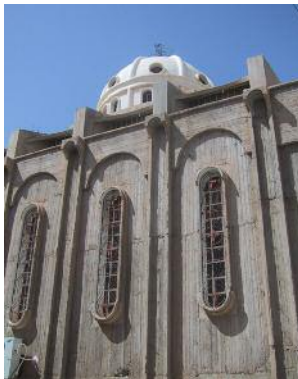
De hedendaagse Assyrisch-apostolische kathedraal in Hassake in Noord-oost-Syrië.