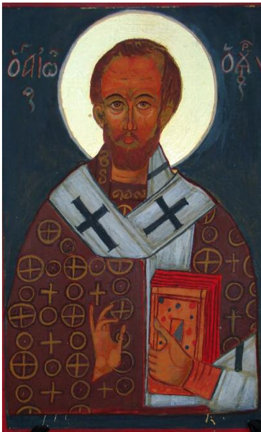
Johannes Chrysostomos [Icoon en foto: C. Nieuwenhuizen].