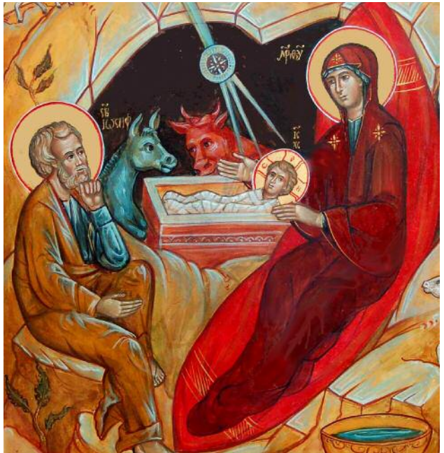
| Fragment van Kersticoon (Icoon en foto: G. Hüsstege).

Hij zou het geweldig vinden als de expositie ook in protestantse gemeentes of orthodoxe parochies kan komen. Er zijn inmiddels contacten daarover. Net als het Jaar van Geloof zelf is de iconenexpeditie over de twaalf Christusmysteries bedoeld om op een beeldende wijze te inspireren tot (hernieuwde) kennismaking met het christelijk geloof en tot geloofsverdieping. Het is tevens een gelegenheid om in combinatie daarmee een lezing over iconen of een uitwisseling over de inhoud van het geloof te houden.