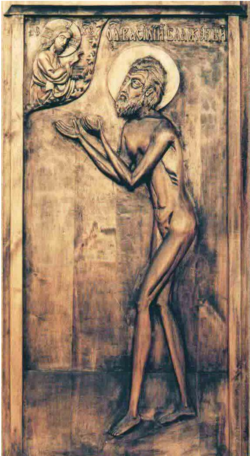
"Rusland was altijd een land dat op zoek was naar liefde." De Gezegende Basilius de Dwaas, een nar om Christus' wil, 15e eeuw, afbeelding uit H.Basiliuskathedraal in Moskou.