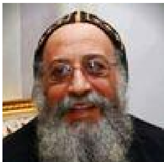
| Patriarch Tawadros II

De nieuwe paus van de Koptisch-orthodoxe Kerk, amba Tawadros II, werd zondag 4 november jl., gekozen en op zondag 18 november geïntrooneerd. 5 November pleitte hij al voor meer bescherming voor