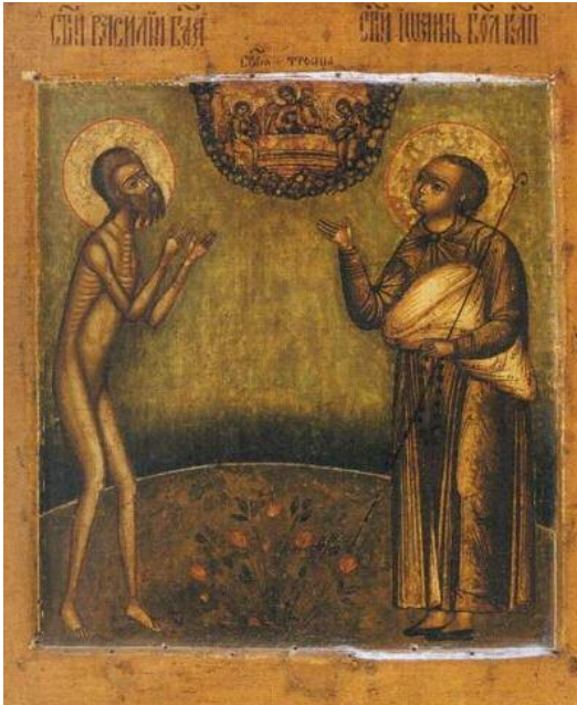
Middeleeuwse Russische icoon van de Gezegende Basilius en Johannes van Moskou, beide heilige dwazen.

De wetgever voerde artikel 213 aan: "hooliganisme door politieke overtuiging", en maakte de meisjes zo tot politieke gevangenen. Een woord is niet niets. Je mag religieuze gevoelens niet kwetsen. Dat is een ethisch uitgangspunt. Maar juridische inhoud heeft deze gedachte niet. Mensenrechtenactivisten hebben hen al gewetensgevangenen genoemd. Maatschappelijke stemmingen veranderen heel snel. Het volk spreidde op de weg palmtakken voor Christus uit en schreeuwde 'Hosanna'. Drie dagen later schreeuwden ze 'Kruisigt Hem, kruisigt Hem'. De 46% die nu (in enquêtes, vert. ) schreeuwen 'Kruisigt hen', kunnen vervuld worden van medelijden, wanneer de meisjes eenmaal veroordeeld zijn. Rusland was altijd een land dat op zoek was naar liefde. 'De Geest waait, waarheen Hij wil en je hoort Zijn stem, maar weet niet waar die vandaan komt en waar die naar toe gaat' (Joh. 3,8). Het volk heeft altijd medelijden met vervolgd en dat slaat als een boemerang op het regime terug.