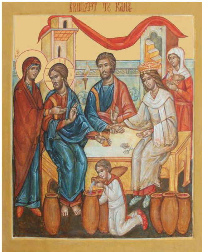
| Bruiloft van Kana (Icoon en foto: G. Hüsstege).

De twaalf iconen zijn gewijd in de Sint-Janskathedraal in Den Bosch op 30 september jl. Kun je iets vertellen over de wijdingsplechtigheid en wat dit voor jou betekende?