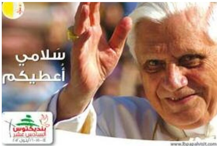
Poster ter gelegenheid van pausbezoek aan Libanon, september 2012.

G ezien de gespannen toestand in de verschillende staten van de regio hebben velen uitgekeken naar deze tekst. Hij biedt een analyse van de situatie van de Katho-