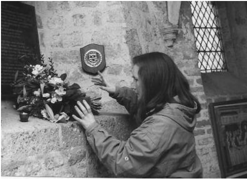
1 Bloemen bij het vredesgebed in de Nikolaaskapel (2011).

nen deze ambitie. Otto II stierf vroegtijdig aan malaria. Theofano werd regentes voor haar jeugdige, al tot koning gekroonde zoon Otto III. Zij regeerde als keizerin met krachtige hand en breidde gewapenderhand het rijk naar het zuiden in Italië en naar het oosten in Bohemen en Polen uit. Ze kreeg vijf kinderen. De dochters Adelheid en Sophia werden abdisen van de kloosters Quedlinburg en Gandersheim. Zo zie je hoe de kerk in die tijd aan de staat gebonden was. Ze stierf vrij jong in 991 in Nijmegen, haar lichaam werd per schip naar Keulen vervoerd en daar volgens haar wens in het Pantaleonklooster aldaar begraven.