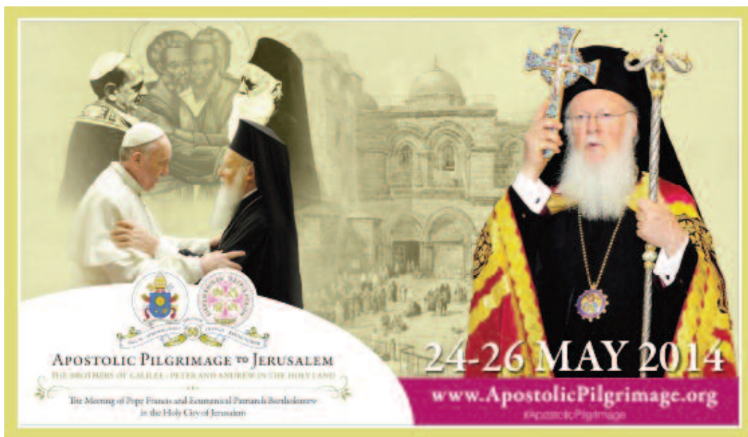
Poster met voor aankondiging van de ontmoeting tussen patriarch en paus.

Toch was de eerste aanleiding van deze pause-lijke reis niet de gespannen ontwikkeling tussen Palestina en Israël of een nieuwe impuls tot interreligieuze dialoog, maar een ontmoeting met de oecumenisch patriarch van Constantijnopel, Bartholomeüs I. Dit onderbelicht aspect is het onderwerp van deze bijdrage.