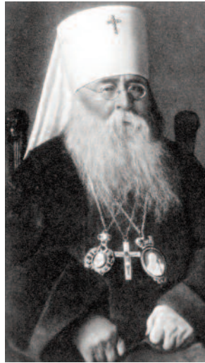
| Metropoliet Sergej

“Deze kerk heeft nooit spijt betuigd over haar compromissen met de Sovjet-macht, een regime dat verantwoordelijk was voor meer dan tientallen miljoenen doden. Zoals de gepubliceerde archieven van de KGB hebben aangetoond, waren de bisschoppen die heden ten dage het patriarchaat van Moskou besturen voor het merendeel, te beginnen met de patriarchen Alexij en Kirill, agenten van de geheime dienst van de Sovjet-Unie. Praktisch niemand van hen heeft een mea culpa uitgesproken. De drie behoedzame spijbtuigingen in naam van de Russische Kerk, door Alexij II in 1990 uitgesproken, zijn van weinig gewicht. Patriarch Alexij II verklaarde op 27 oktober 1990 inderdaad dat de Bisschoppelijke Synode zich niet meer gebonden voelde aan de verklaring van onderwerping aan het Sovjet-regime van metropoliet Sergej in 1927. Maar in die zelfde verklaring meent hij deze onderwerping aan de civiele machten in principe te kunnen rechtvaardigen met een beroep op de apostel Paulus. Men moest wachten tot het jaar 2000