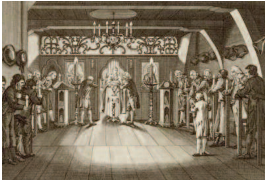
Prent van de Goddelijke Liturgie in de Orthodoxe zolder- kerk in het pand 'De Drie Valken' te Amsterdam, 1786.

Grieks/Russische H. Katharina-parochie te Amsterdam (1752-1868)