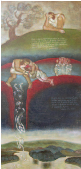
St. Elia doodt de valse profeten. (2014; schildering en foto: J. Stankova)