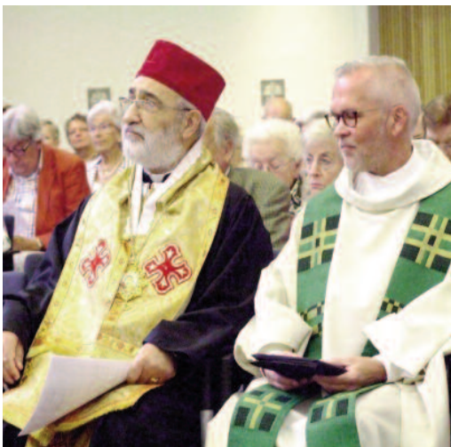
Mgr Antiba tijdens een oecumenische viering in Breda op het einde van Vredesweek van 2014.

'Mijn land bevindt zich in een macabere situatie waar slachtpartijen en moorden verdergaan. Het is een verschrikkelijke ramp, maar het is wel mijn land en de bakermat van het christendom. Er zijn de destructieve en bloedige gebeurtenissen in Irak, de vervolging van de Koptische christenen in Egypte en van christenen in Syrië en Palestina, het militante seculiere zionisme, het ontstaan van verschillende religies en sekten, de terugkeer naar religieus sektarisme die de vrije menselijke aanwezigheid verstikt. "Arabisme" werd voor bepaalde moslims - de islam heeft hiermee niets te maken - een excuus voor het maken van onderscheid tussen Arabieren en moslims, salafisten en ongelovigen, tussen christenen en moslims, tussen soenni-