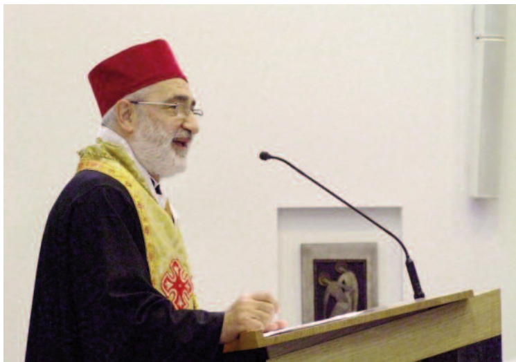
┆ Aartsbisschop Nicolas Antiba

'Al voor de komst van de islam leefden hier enkele eeuwen talloze christelijke stammen. Het christendom vormde de culturele en religieuze basis waarop de islam op het Arabische schiereiland werd gevestigd. Een paar vrienden