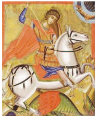
Sint-Joris, Kretenzische icoon ± 1500.