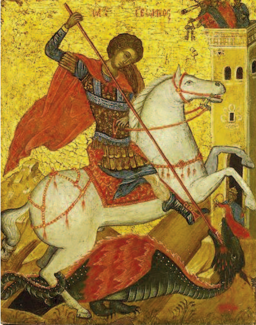
Sint-Joris en de Draak, Kretenzische icoon, 16 e eeuw.

Volgens de overlevering werd Sint-Joris, de heilige Georgius, in het laatste kwart van de derde eeuw geboren in Lydda, een stad in de Romeinse provincie Syrië-Palestina. Hij kwam uit een Grieks-christelijke adellijke familie en werd christelijk opgevoed. Zijn vader was officier in het Romeinse leger. Hij verloor zijn ouders kort na elkaar, nog voor hij zelf twintig jaar oud was. Als jongeman trok hij naar de keizerlijke hoofdstad van het Oost-Romeinse Rijk, Nicomedia, om carrière te maken in het leger van keizer Diocletianus. Na enige jaren werd hij opgenomen in de keizerlijke lijfwacht.