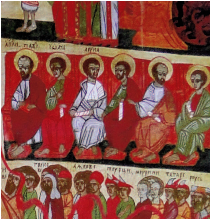
Zes van de 12 medetronende Apostelen (uitsnede), hier die ter rechterzijde met aan het hoofd Sint-Paulus (scène 9).

nen zijn. Hysop staat voor reiniging en nederigheid en riet voor een positief toekomstbeeld.