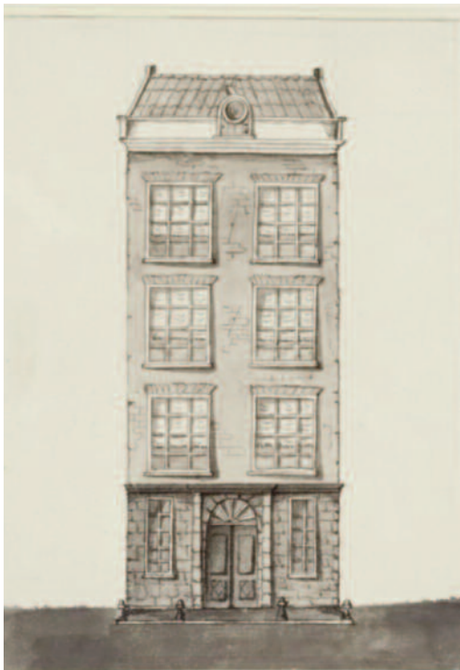
Gevel van het pand 'De Drie Valken' rond 1830, prent.