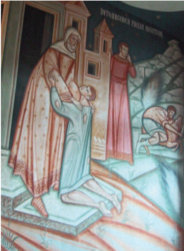
| Muurschildering van de Verloren Zoon in een Roemeens-orthodox klooster, Zuid-Moldavië.

voor wie ik heel de kosmos die ik schiep, heb getooid, ik, de Meester en Heer der eeuwen.