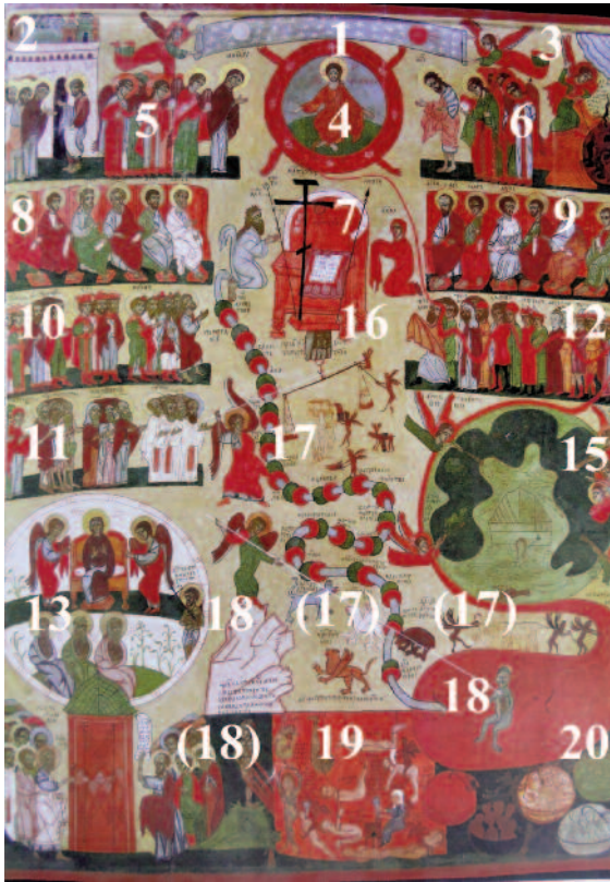
Het Laatste Oordeel, de Oost-Slowaakse icon in de kerk van Lukov-Venecia. (Zie ook in kleur: de cover van deze Pokrof)

kort was om nog tot inkeer te komen, mocht hij - blootgesteld aan de verleidingen van de duivel - gekozen hebben voor de aantrekkelijke 'brede' weg, die leidde tot zijn verderf. Het was daarom zaak de gelovigen bij de les te houden en hen er in woord en niet mis te verstande beelden van te doordringen zich verre te houden van zondige praktijken, wilden ze in aanmerking komen voor een plaats in de hemel.