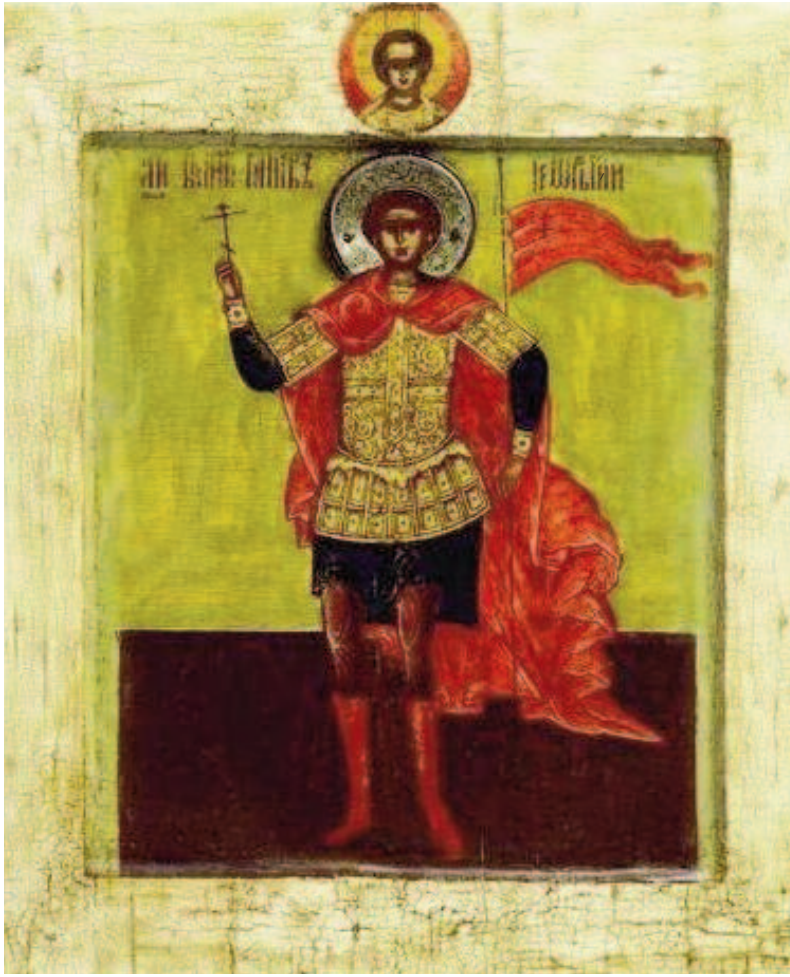
Staaude Sint-Joris, zonder paard en draak. Russische icoon, Stroganov-school, 17 e eeuw.

I n het jaar 303 brak de zogeheten Grote Vervolging uit, die tot 311 zou voortduren. Het begon met een aantal edicten die Diocletianus uitvaardigde en die gericht waren tegen de christenen. De ontwikkeling ontaarde in zware vervolgingen. Sint-Joris bezweek niet voor de druk die de keizer op hem uitoefende om zijn christelijk geloof af te zweren en in plaats daarvan offers te brengen aan de Romeinse goden. Ook wees hij herhaalde malen het aanbod van de keizer af om zich te 'bekeken' in ruil voor geld, land en slaven. Het werd zijn doodvonnis. Sint-Joris stierf als martelaar en werd begraven in Lydda, zijn geboorteplaats. Daar kwamen al spoedig christenen naar toe om hem te vereren, en er verrees een kerk met zijn naam. In de loop van de vierde eeuw verspreidde de verering van Sint-Joris zich vanuit Palestina naar de rest van het Oost-Romeinse rijk. De daaropvolgende eeuw werd