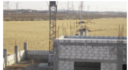
Electriciteits-aggregaat van Melkietisch aartsbisdom, Khabab (Zuid-Syrië).