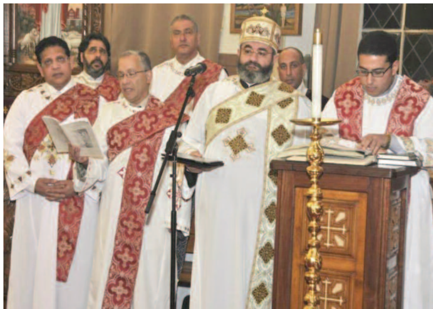
Koptische diakens, de feitelijke zangers, in de Koptische Mariakerk in Amsterdam-Noord.

Vitaal in het Midden-Oosten en Nederland