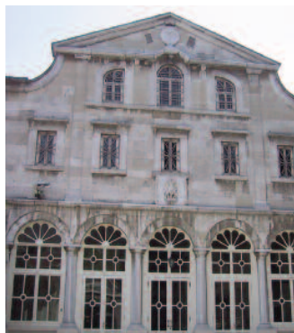
Sint-Joriskerk, de huidige Patriarchale kerk in Istanbul.