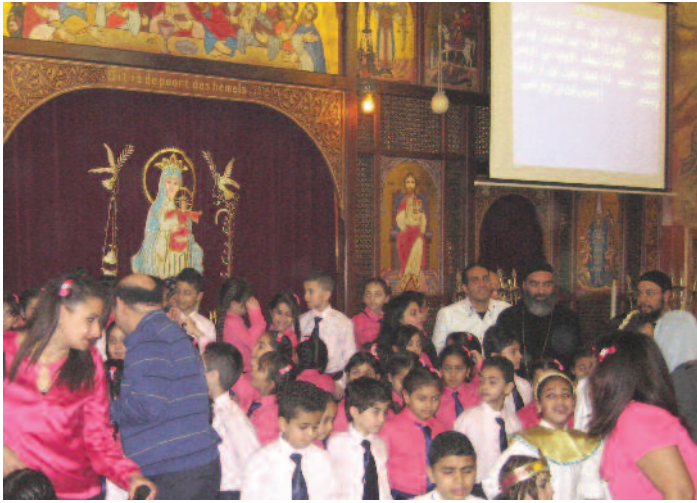
Zondagsschoolbijeenkomst na het toneelstuk in de Koptische Mariakerk.

moslimextremisme. Veel werkloze en weinig ontwikkelde Egyptenaren zoeken werk in de rijke Golfstaten. De moslims onder hen komen vaak terug, geïndoctrineerd door de salafistische islam, die hen vijandig maakt tegenover christenen. Toch maakt deze onderdrukking het geloof van de Kopten alleen maar sterker. Paus Tawadros zei naar aanleiding van de kerkverwoestingen: “Brandende kerken zijn als brandende wierookvaten die wij gaarne offeren voor het land Egypte.” En zijn voorganger, paus Shenouda, leerde: “Het bloed van de martelaren is als het water voor een plant.”