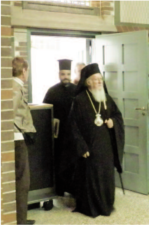
Patriarch Bartholomeos I betreedt de Oud-katholieke kathedraal in Utrecht tijdens zijn bezoek aan Nederland in 2014.

kerk. In rang stond hij – evenals het stadje zelf – niet erg hoog. Byzantium's bisschop ressorteerde onder de aartsbisschop van Thracië in Heraclea, een stad 90 km verderop.