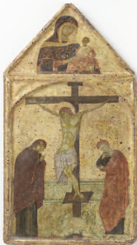
Icoon, Christus aan het kruis, met Maria en Johannes, anoniem, ± 1250.

Bij iconen is iets bijzonders aan de hand. Anders de panelen in dezelfde vitrine van de Fra Angelicozaal, stellen iconen present. Wat afgebeeld staat is aanwezig en kan vereerd worden,