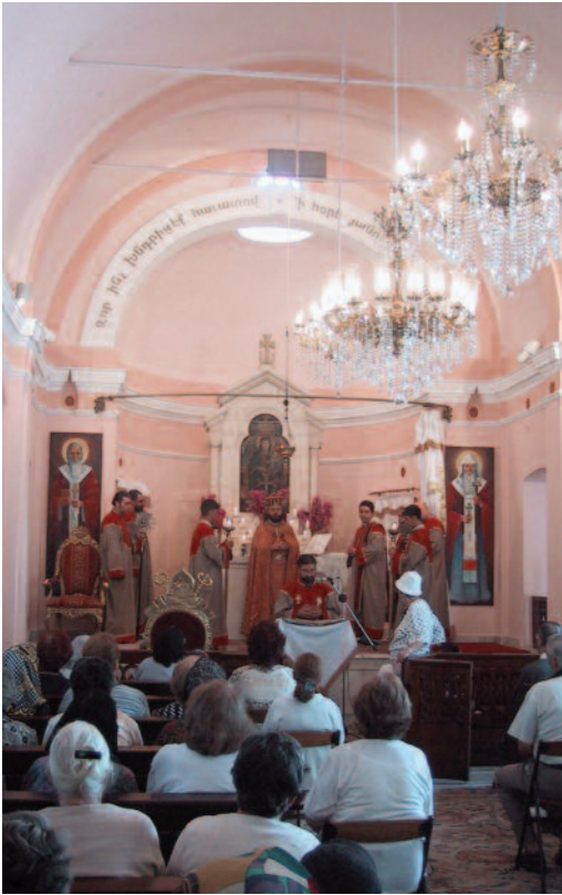
Armeens-Apostolische dienst in Istanboel.

de Assyrische Kerk terecht worden onderscheiden van de Oriëntaals-orthodoxe Kerken, die uitgaan van één godmenselijke natuur van Christus (= miafysitisme). Van beide onderscheiden is de Maronietische Kerk (West-Syrië, Libanon) die - ooit - het leerstuk van één godmenselijke wil en energie in Christus aanhing (= monotheïetisme resp. monenergisme).