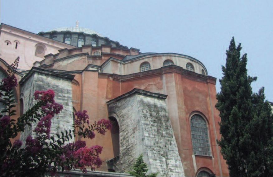
Zijaanzicht van Aya Sofia, Istanboel.

Constantinopel, stad aan de Gouden Hoorn. Dat klinkt groots en aanlokkelijk.