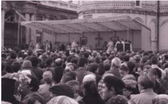
Grootse herdenking in Boekarest van de heilige grootmartelaar Dimitrie van Thessaloniki.

paus uitnodigde. Begin oktober 2002 bracht patriarch Teoctist een tegenbezoek aan Rome. De media berichten er tijdens mijn verblijf in Roemenië nog uitgebreid over. Ik maak