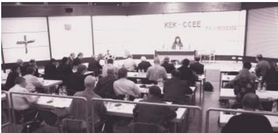
Afgevaardigden van dertig landen in de congreszaal in Ottmaring.

(beleidsmedewerker oecumene op het Secretariaat van de Rooms-Katholieke Kerk)