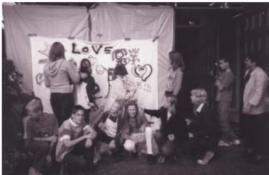
Jongeren bij hun credo-graffiti.

zijn opgezet. Bestaande groepen zijn ingelicht over het thema en gevraagd of ze er mee aan de slag konden. 'We hebben de indruk dat veel bestaande groepen zich met het thema bezighouden. Het thema lijkt goed te vallen. Maar we krijgen ook kritische vragen, of we het credo terug willen, of juist niet en dat dit jaar dan moet aantonen dat mensen er niets meer mee kunnen. Verder willen sommige heel graag praten over het credo omdat ze met sommige woorden niets aan kunnen vangen, terwijl anderen dat juist helemaal niet willen, omdat de woorden en formuleringen van het