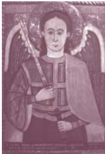
Roemeense icoon van aartsengel in het museum in Stavropoleos.

De Roemenen voelen zich westers, maar hun christendom is overwegend oosters. Christelijk Roemenië hoorde ooit tot de byzantijnse wereld. Toch is de taal niet Grieks of Slavisch, maar van Latijnse origine. Dit, en nog zoveel andere trekken, maken het hedendaagse oosterse christendom van Roemenië tot een boeiende wereld, die steeds dichterbij komt door de voortgaande eenwording van Europa, maar die ook nog erg onbekend is. En hoe staat het in Roemenië eigenlijk met de eenwording van de christenen onderling, de oecumene? Gedurende heel 2003 zal er aandacht zijn voor het oosterse christendom van Roemenië, onder andere op de Zondag voor de Oosterse Kerken 2003 in het weekend van de Vijfde Zondag na Pasen (17-18 mei).