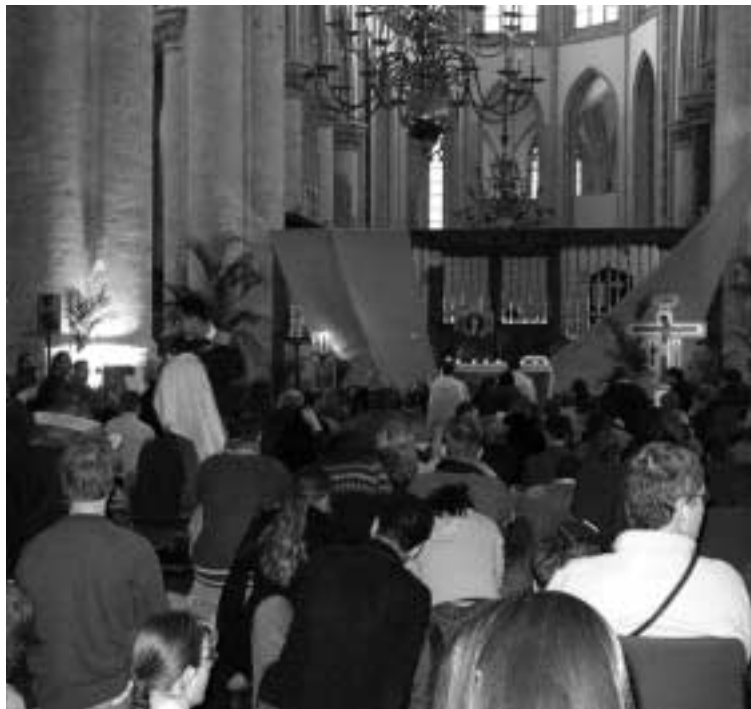
Taizéviering in de Grote Kerk in Breda.

Tijdens het weekend stonden het gebed en de ontmoeting centraal. De broeders van Taizé hielden een bijbelintroductie, waarna de jongeren een plekje zochten op de vloer van de kerk om erover met elkaar in gesprek te gaan. De Grote Kerk in Breda was het centrale punt van gebed, maar zaterdagmiddag waaierden de jongeren uit over de hele stad, waar ze plaatsen bezochten die waren aangemerkt als 'plekken van hoop', plaatsen waar volgens de organisatoren hoopgevend werk wordt verricht. Deze varieerden van de KMA, waar cadetten vertelden over hun zienswij-