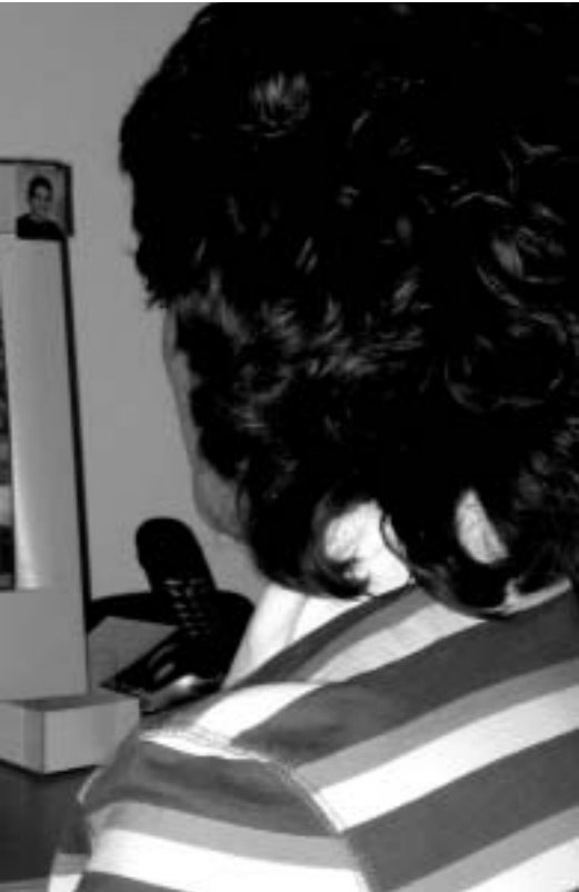
Helda met op het bureaublad van de computer een foto van haar broer in Irak.

keer ontsnapt bij een bomaanslag. Zijn foto staat op het bureaublad van de computer. Telkens als er een autobom is ontploft, zit ze met angst voor familie en bekenden biddend voor de televisie. Een neef werd slachtoffer van een afrekening: "Ze belden aan en zijn moeder deed open. Een man, die netjes zijn naam noemde, vertelde dat hij voor haar zoon kwam. Ze riep hem. Toen hij naar buiten liep werd hij doodgeschoten." Hij werkte voor de Amerikanen.