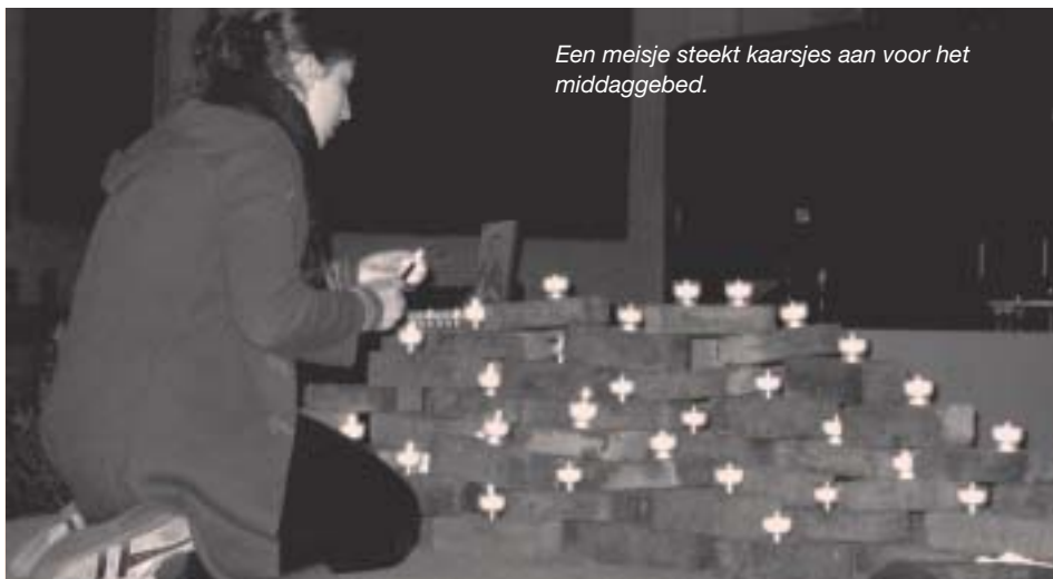
Een meisje steekt kaarsjes aan voor het middaggebed.