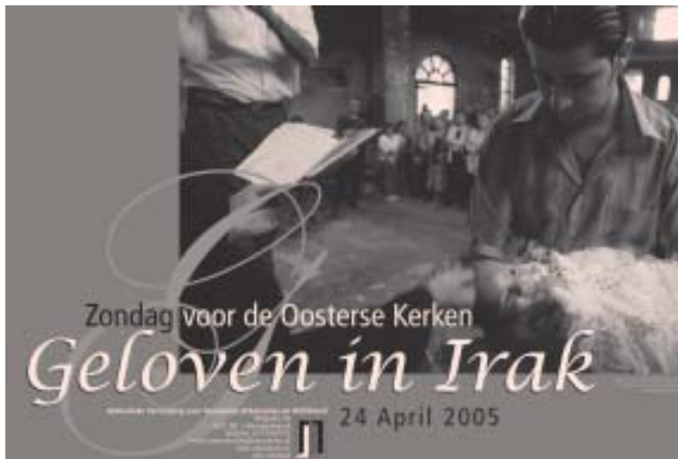
Poster van de Zondag voor de Oosterse Kerken. Doop in een door een bomexplosie beschadigde kerk in Bagdad. In de digitale brochure op www.oecumene.nl is een interview opgenomen met de pater die de doop bedient.

De poster van de Zondag voor de Oosterse Kerken beeldt een doop af in een door een bomexplosie beschadigde kerk. De foto is uitdrukking van de kwetsbaarheid én het geloof van de christelijke gemeenschappen in Irak.