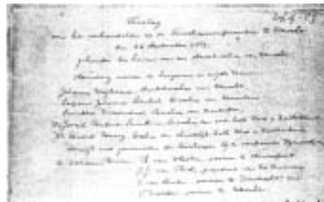
Namen van oud-katholieke bisschoppen aan het begin van het verslag van de eerste oud-katho- lieke Bisschoppenconferentie van 1889.

In het eerste geval neigt men er toe de gezagsstructuur in de kerk van boven naar beneden te zien, in het tweede geval juist omgekeerd. In het eerste geval hecht men sterk aan het centrale gezag van de pri- maat, in het tweede geval aan dat van de gezamenlijke bisschoppen als vertegen- woordigers van hun lokale kerken. Dit thema kwam als eerste aan de orde en resulteerde in een, nog niet definitief gere- digeerde, overeenstemming. Daarnaast inventariseerde men de theolo- gische vragen waarin men reeds voorheen overeenstemming had bereikt, zoals de sacramentaliteit van het Kerk zijn en het apostolische ambt van diaken, priester en bisschop. Zo ligt dan als pièce de résistan- ce voor de volgende bijeenkomst(en) de vraag naar het pauselijk primaat op de tafel.