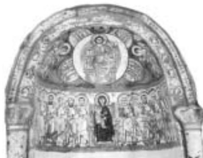
Oud Koptisch fresco uit Egyptisch woestijnklooster, Tronende Christus (Apok 4).

en maakt zowel religieus als maatschappelijk een renaissance door. De Kopten verwerven gelijke burgerrechten en bestrijden met hun islamitische landgenoten zij aan zij de Britse overheersing (1882-1922). Kopten nemen volop deel aan de politiek.