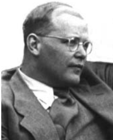
Dietrich Bonhoeffer (1906-1945).

God, waarom hebt Gij mij verlaten?'" Het aardse leven van Jezus Christus was niets anders dan er zijn voor anderen. In het geloof participeert de mens aan het leven van Jezus en wordt vrij voor anderen.