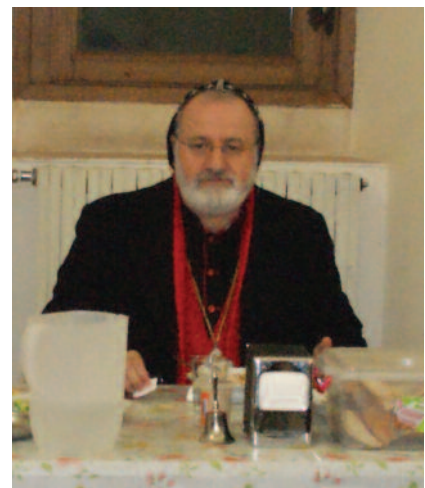
◆ Aartsbisschop Saliba

Dit om in samenwerking met hen de fondsen die we hopen op te halen voor deze vluchtelingen, in goede orde bij bisschop Saliba terecht te laten komen. ○