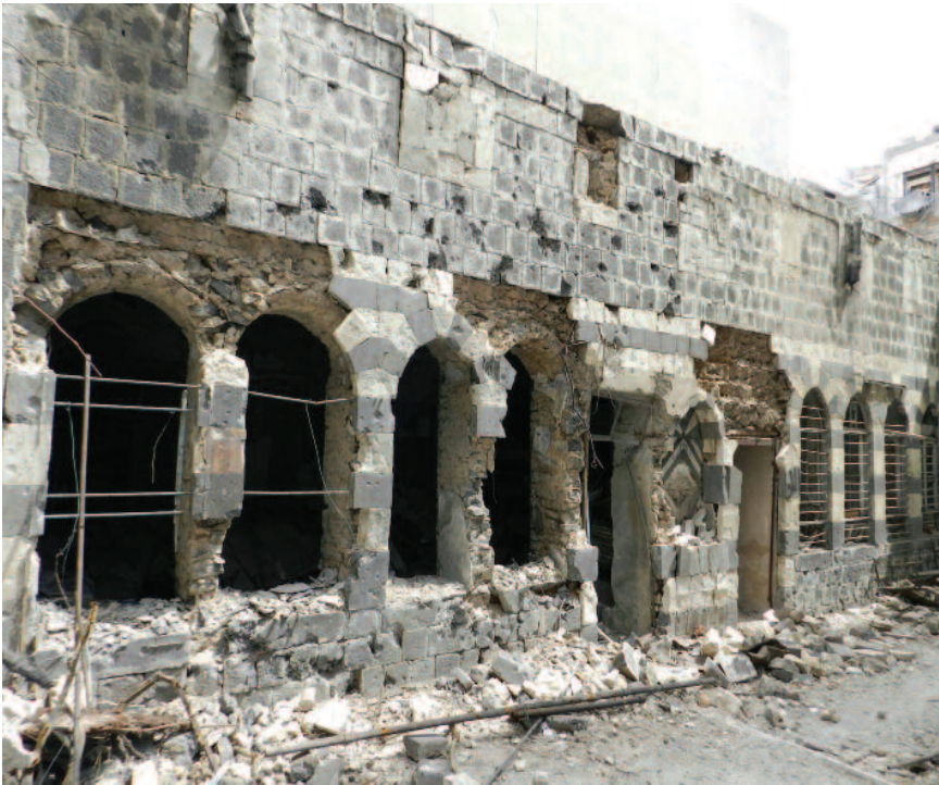
◆ Verwoesting in de Bab Dreeb wijk in Homs.

amalgam van verschillende groepen, sommige 'autochtoon' vanaf het prille begin van het christendom, dus van voor de komst van de islam (vanaf 643), andere ooit van elders uit het Midden-Oosten gekomen en volledig ingeburgerd.