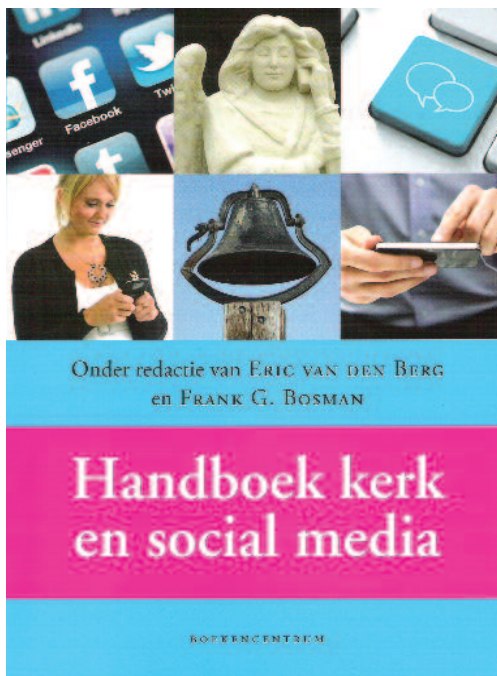
◆ Omslag Handboek Kerk en sociale media

Het boek bestaat uit twee delen. In het eerste wordt een introductie gegeven van de soorten en het gebruik van social media. Er wordt daarbij hier en daar wel een connotatie gelegd met gebruik in kerken, maar dat is dan toch vooral secundair. In dit deel veel terminologie en theoretische modelschetsen. De samenstel-