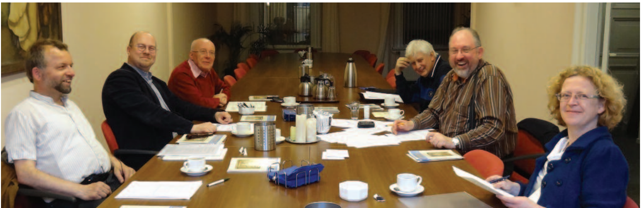
◆ Redactie Pokrof

Deelnamekosten bedragen slechts E 10,—. Voor meer informatie zie www.oecumene.nl . Aanmelden graag via secretariaat@oecumene.nl . Na aanmelding ontvangt u een bevestiging van deelname.