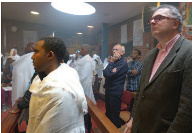
◆ Dienst in de Ethiopische kerk in Pernis

Die vreugde wordt alleen maar groter wanneer we aan het eind van ons programma ergens in den lande een orthodoxe viering bezoeken. Een 'totaalbeleving' zoals dat heden ten dage heet – een geloofservaring klinkt beter. Dichtbij het geheim van