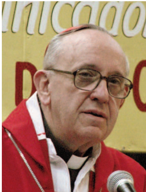
◆ Kardinaal Jorge Bergoglio sj, aartsbisschop van Buenos Aires, werd gekozen tot nieuwe paus. Het is de eerste paus uit Latijns Amerika en de eerste paus Franciscus.