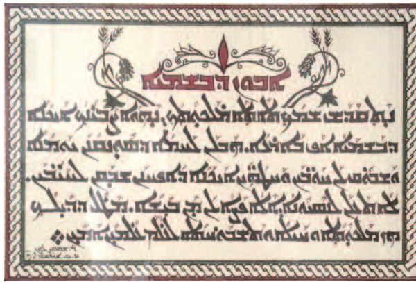
◆ Aramese versie Onze Vader

De leerlingen van Jezus wilden blijkbaar eveneens zo'n zelfde soort gebed, dat vanuit de boodschap die Je-