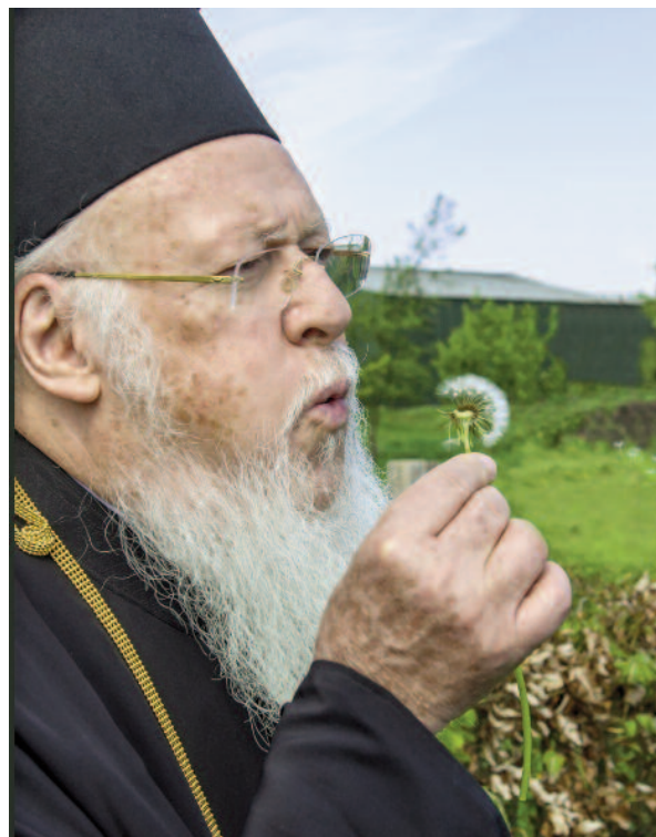
◆ Uitsnede cover