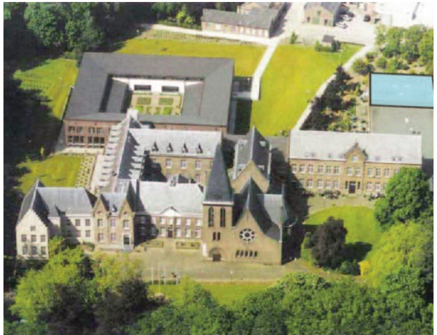
◆ De abdij van Berne

Op 8 december van het vorige jaar werden op heel veel plaatsen in de wereld 'deuren van barmhartigheid' geopend. In algemene zin werden we op initiatief van paus Franciscus uitgenodigd om meer dan gewoon stil te staan bij de vraag hoe barmhartig en mild we met elkaar omgaan. Als een spiegel worden ons indringende vragen voorgehouden: zien wij vooral het vreemde en eigenaardige van de ander en leven we gedachteloos langs het goede heen? Gun ik iemand die de fout is ingegaan ook een nieuwe kans? Ben ik werkelijk bereid tot hulp als iemand in nood is? Het woord barmhartigheid klinkt voor veel tijdgenoten waarschijnlijk wat ouderwets en gedateerd. Wat is barmhartigheid eigenlijk? Misschien kan het Latijnse woord voor barmhartigheid – misericordia – ons verder helpen. Iemand met misericordia heeft een hart (cor) voor mensen in ellende (misen): zondaars, armen, bedroefden, zieken een eenzame mensen.