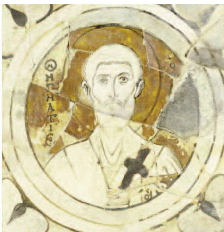
◆ Foto: Icoon van Ignatius van Antiochië, in keramiek en glas, Constantinopel 10 e eeuw, Walters Collection.

Denis Hendrickx o.praem. is abt van de Abdij van Berne.