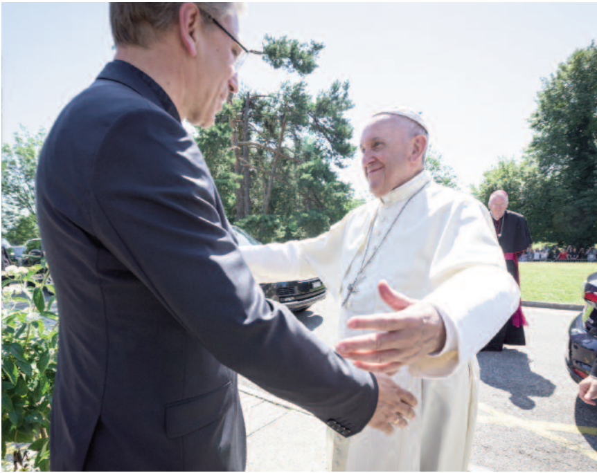
◆ Secretaris dr. Fykse Tveit ontvangt paus Franciscus in Genève

corruptie. De weg van de Geest is herkenbaar aan de vruchten: liefde, vreugde, vrede, geduld, vriendelijkheid, goedheid, vertrouwen, zachtmoedigheid, zelfbeheersing. (Gal. 5,22-23).