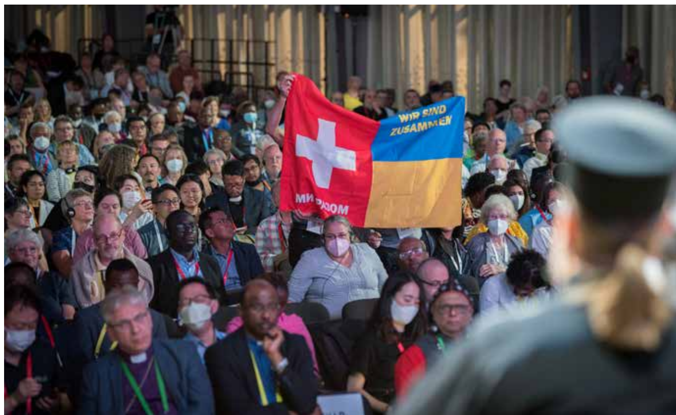
“Een Oekraïense bisschop ontvangt steun tijdens zijn bijdrage aan de assemblee te Karlsruhe. September 2022, Albin Hillert/WRK.”