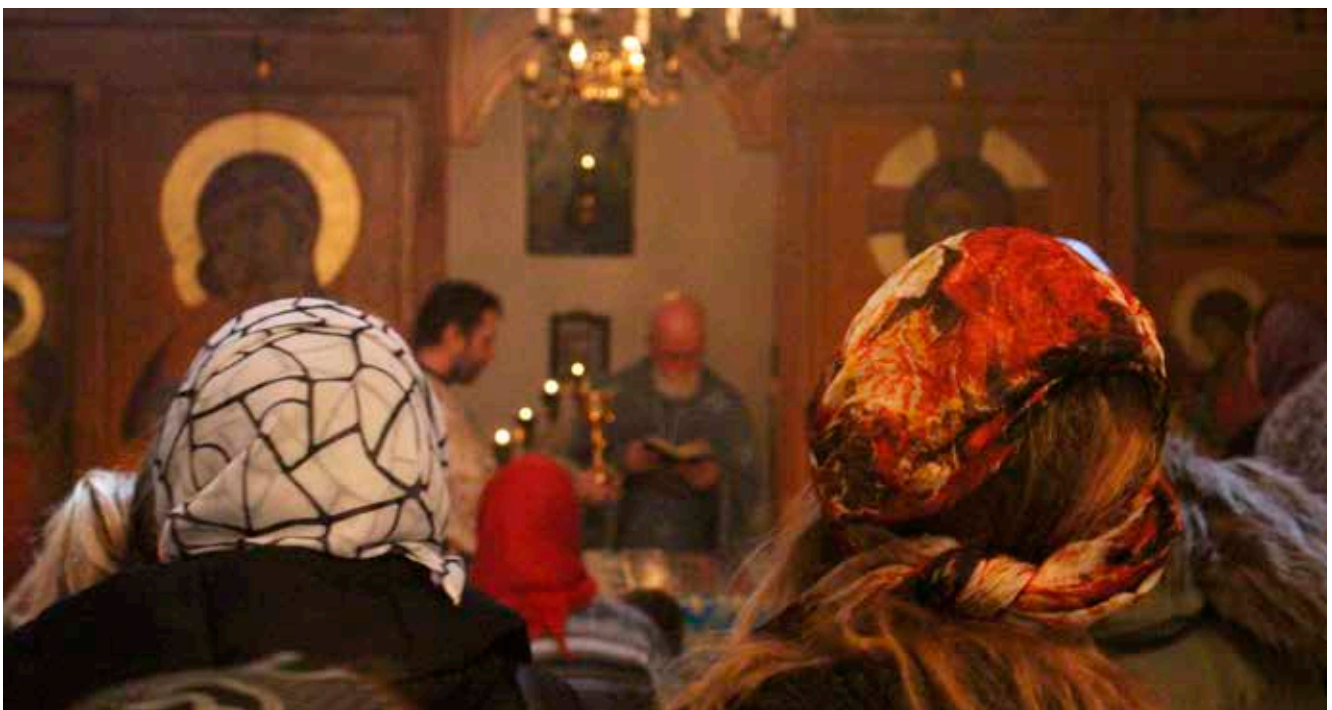
Oekraïense vluchtelingen bidden in de Russisch-Orthodoxe gemeenschap in Deventer, 18 februari 2023.