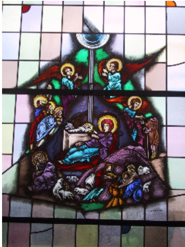
Geboorte van Christus, glas-in-lood, 20 e eeuw, Syrisch-orthodoxe kathedraal te Glane-Losser

Onderstaande tekst over Syrische 'Advent' en Kerst is een actuele bewerking van een meditatie die werd gehouden voor Radio Maria op 22 december 2009.