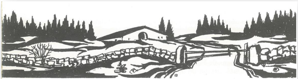
Figuur 1 Boerderij in de Jura. Houtsnede Daniel Dubois 1969

Geïnterneerde moeders en kinderen op de vlucht gaan ons voor. Heeft voor haar het alledaags (over-)leven niet de betekenis moeten krijgen van een Last Resort? Een toevlucht tot het enige noodzakelijke? Potten en pannen die de betekenis krijgen van tempelgerei? Vandaar het citaat van Zacharias. Zonder het onbegrijpelijke van zo'n situatie voor een comfortabel westers huishouden tekort te doen probeer ik "in een andere versnelling" 9 enigszins te ontvlechten wat in de loop der tijd een meer theologisch gehalte heeft gekregen dan ik kon vermoeden. In hoeverre die horen bij "een doperse identiteit" laat ik in het midden omdat het nog steeds "mijn midden" is. Aan de hand van een motief dat voor mij een verbreding en niet een vernauwing is gaan betekenen als kenmerk van gemeente zijn. Het is het motief van de "verborgenheid" als nieuwe ruimte voor een zoektocht die niet meteen antwoorden op de vragen heeft: