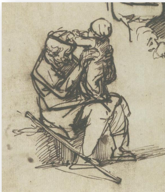
Figuur 2 Grootvader spelend met kleinkind. Tekening T325 van Rembrandt

Echter als verborgenheid een tweede natuur wordt – innerlijkheid en uiterlijkheid niet meer samen beoefend worden, is de dynamiek tussen beide verdwenen. Wordt het ook moeilijk om een roeping te doen ontwikkelen, losgezongen als ze is van haar context. Afscherming op zich hoeft niet verkeerd te zijn, 10 maar blijkt bij het doorgeven van een geloofstraditie catastrofaal. Maar ook bij gebrek aan